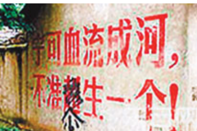
內地農村仍有類似「寧可血流成河，不可超生一個」的暴力標語。 網上圖片