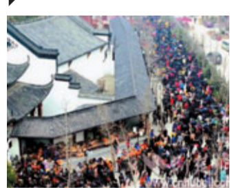
武漢歸元禪寺香火鼎盛。

隨著信息化的飛速發展，有着300多年歷史的湖北武漢歸元寺也在變。早在2010年8月，方丈隆印就開通了微博，眼下已經有近300萬粉絲。今年年初，歸元禪寺還開通了電子祈福屏。以水墨為基調的歸元寺的網站，如今也進入了最後的測試中。眼下，歸元寺正計劃籌備義工助陣，並醞釀通過以視頻的形式傳播歸元文化。2010年8月，歸元禪寺方丈隆印法師加入了微博行列。記者初步計算了一下，方丈的兩個微博上，一共有近300萬粉絲。