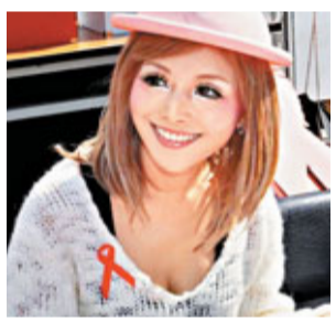
曾經是AV女優的紅音螢如今是防艾大使。

一條關於華師性學專家彭曉輝欲請日本女優紅音螢到華師上課的消息23日在各大微博上瘋轉。彭曉輝24日證實有此打算，正準備向學校申請，但結果尚未可知。記者從網上查知，今年29歲的紅音螢，是日本曾經紅極一時的AV(成人電影)女星，但在2008年退出AV界。將曾經的AV女星邀請進華師的課堂？彭曉輝笑稱，只是有此打算，正準備向生科院申請備案。彭曉輝認為，她過去是AV女星，但現在是防艾大使，自然可以進課堂和大學生交流。半年前，彭曉輝在微博上遇到紅音螢。前者是從事性學研究的，而後者是防艾大使，兩人算得上是「同行」。今年3月，紅音螢將以私人朋友的身份來訪從事性學研究達20年的彭曉輝。得知消息的華師學生反應十分強烈，有人預言這將會成為華師109年歷史上人數最多的課。昨日，華師生科院負責人稱，對於紅音螢能否進華師課堂，學校還要研究才能決定。