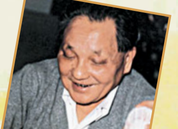
鄧公以愛打橋牌出名。

獎儀式上說：「對世界橋聯來說，今天是一個不平凡的日子，因為我們為一位偉大的人物頒獎。」他說，世界橋聯目前有83個會員，70萬名註冊牌手，世界上喜愛橋牌運動的人超過5000萬。1993年6月4日，世界橋牌聯合會主席鮑比·沃爾夫和北美橋聯秘書長楊小燕，在北京分別代表各自的聯合會，向中國橋牌榮譽主席鄧小平和名譽主席萬里頒發世界冠軍金牌獎和主席最高榮譽獎，以感謝他們為促進中國橋牌運動的開展作出的不可磨滅的貢獻。