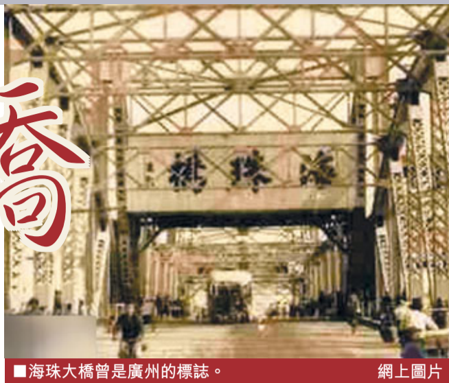
海珠大橋曾是廣州的標誌。

已有79年歷史的城市標誌性建築「廣州第一橋」海珠橋，25日起開始試封閉，28日將開始進入為期18個月的「閉關大修」。「海珠橋要大修了，趁封橋前去拍張照片吧！」連日來，廣州市民紛紛發出類似感慨，許多市民都專程到大橋周邊拍照留念。