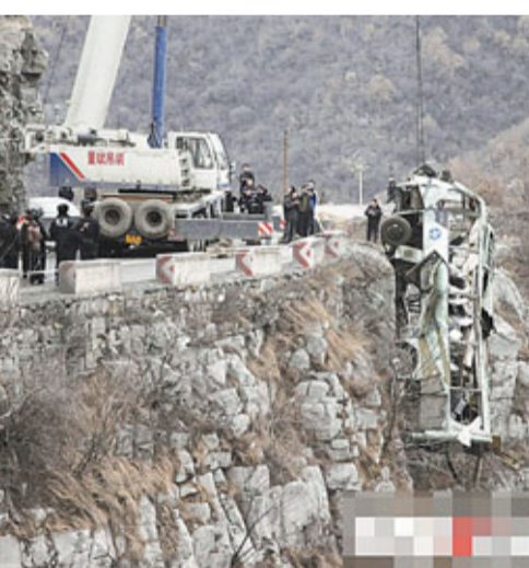
25日,河南一輛旅遊大巴,從山西晉城開往河南濟源,在207國道高平段翻入百米山溝。車上核載35人,實載33人,目前已有15人死亡。