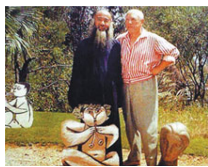
張大千拜訪畢加索工作室。

報指近年中國藝術家作品在世界藝術品拍賣市場上十分走俏,幾乎主宰高端市場。2011年拍賣額排名第二的是已故畫家齊白石的作品,總拍賣額達5.1億美元(約40億港元)。排名前十的藝術家中有6位來自中國。中國藝術品的拍賣額佔總交易額40%。