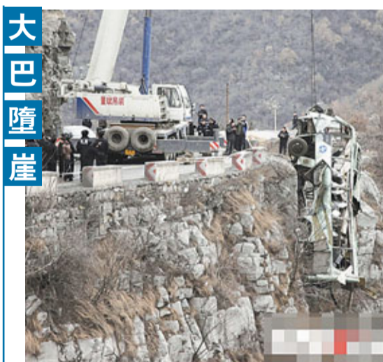
25日,河南一輛旅遊大巴,從山西晉城開往河南濟源,在207國道高平段翻入百米山溝。車上核載35人,實載33人,目前已有15人死亡。

腺病毒是人類呼吸道感染的常見病原,可通過呼吸道飛沫和密切接觸傳播。病例主要表現為發熱、咳嗽、咽痛等症狀,絕大多數病例症狀較輕,預後良好。