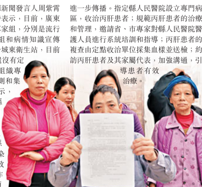
■響水路的村民寫了一封求救信，希望政府重視他們的訴求。

進一步傳播。指定縣人民醫院設立專門病區，收治丙肝患者；規範丙肝患者的治療和管理，邀請省、市專家對縣人民醫院醫護人員進行系統培訓和指導；丙肝患者的複查由定點收治單位採集血樣並送檢；約訪丙肝患者及其家屬代表，加強溝通，引導患者有效治療。 有不少居民反映，城東衛生站對面的縣第二小學（見圖），由於沒有校醫，很多感冒發燒的師生選擇在這家診所看病，已有不少學生感染，教師當中亦有10多人患丙肝。到目前為止，學校還沒有對師生進行全面檢查，若安排檢查，相信有相當數量的學生感染。