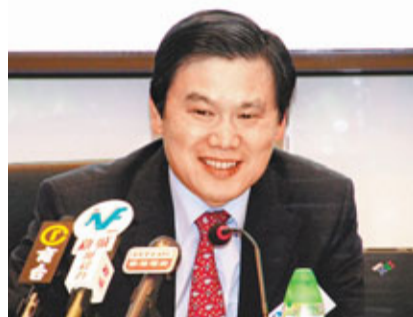
■ 閻峰希望今年可參與超過10宗新股上市。

香港文匯報訊(記者 余美玉)中資券商國泰君安國際(1788)昨公布,受貸款及融資活動所帶動,利息收入顯著增長,去年純利同比增長14.8%至2.88億元,每股盈利0.175元,派末期息0.06元,合計全年派息0.09元。期內收益達7億元,按年增7.4%,其