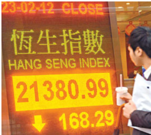
■港股昨低開193點後，大市持續低走，收跌168點，主板成交縮減至605億元。

香港文匯報訊（記者 馬子豪）港股利好消息出盡，港股昨借勢調整，恒指最後跌168點。閩市下二三線股份繼續受追捧。證券業人士指，大市進入整固期，投資者物色落後股炒上，料市況可於下週藍籌股業績潮展開變得明朗。 恒指昨日悶局，收市跌168點，收報21,380點，主板成交縮減至605.26億元。即月期指則收報21,387點，跌107點，轉高水6點。