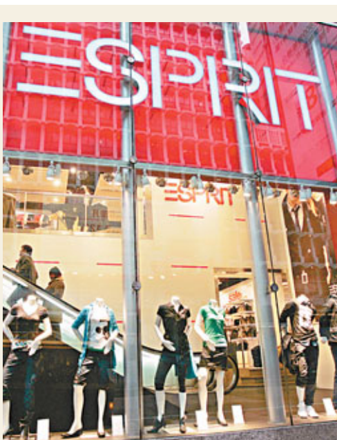
■思捷中期純利雖然按年大跌74%，但仍比市場預期佳。