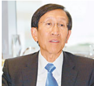
■方正稱，若貿然調降收費水平，擔心當大市成交縮減會影響財政。

香港文匯報訊（記者 周紹基）證監會計劃在下月初，就明年度的開支預算，再次提交立法會財經事務委員會審閱。由於證監會坐擁74億元儲備，相等於七年開支，在沒有調低交費，在沒有調低交費，月初提交開支預算時不獲通過，多名立法會議員要求證監會減收股票交易徵費。但消息指證監會無意減收交易徵費，僅會寬免中介人牌費，證監會主席方正未有對此置評。