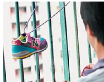
最佳戲劇 (非動畫) 及最佳演繹隊伍《我的鞋子》