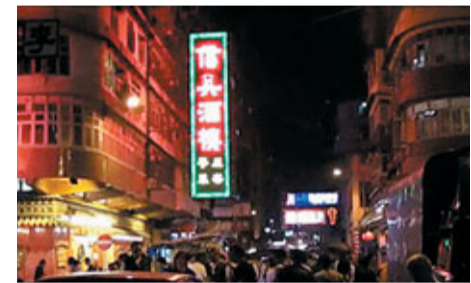
最佳校園 (中小學) 創作《飯菜傳情》

「第五屆香港流動影片節」近日頒布「影片製作比賽」各獎項。其中，《相簿二三事》成為今屆賽事的大贏家，獲得包括最佳動畫、最佳故事及榮譽大獎。該片導演莫韻兒以動畫形式，描述與家人的關係及緬懷個人成長。最佳戲劇 (非動畫) 獎的《我的鞋子》，導演盧志偉是一名紀律部隊人員，首次拍攝影像，需要克服重重困難，最後以完整的故事結構及系統地領導眾演員演出而奪獎。今年新增的最佳紀錄片獎《油麻地人說》，拍攝團隊一行四人，走訪了油麻地內不同階層人士，細說區內歷史及表達對該區的深厚感情。其有趣的剪接及電腦效果，盡顯80後製作團隊的活潑風格，極富心思。90後表現同樣突出，香港正覺蓮社佛教梁植偉中學鍾朗民同學創作的《飯菜傳情》，以舊區廉價飯店為題，道出弱勢社群獲關注的真實故事。此外，跳舞工作室Work It Out Dance Studio憑《Work It Out Dance Studio Self-promotion Short Film》奪得今年特設的康宏最佳創意大獎。