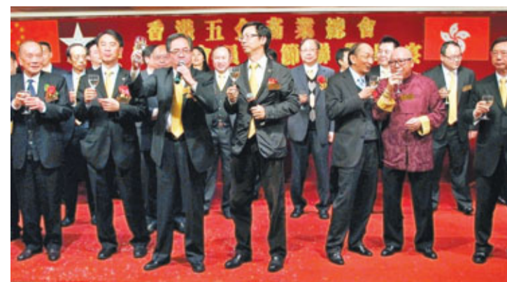
香港五金商業總會歡慶慶祝酒會。

「新家園協會」是由世茂集團董事局主席許榮茂與恒基兆業地產集團副主席李家傑牽頭，聯同其他傑出商界人士出資1.2億元，在香港成立的專為新來港人士服務的慈善團體。自2010年6月成立以來，新家園協會陸續在香港的港島、九龍東、九龍西、新界東、新界西5區分別成立地區服務處，並在內地民政部下成立民辦非企業單位新家園社會服務中心，在廣東的廣州、深圳，福建的泉州設立服務處，至今已為新來港及準來港人士服務超過67,000人次。