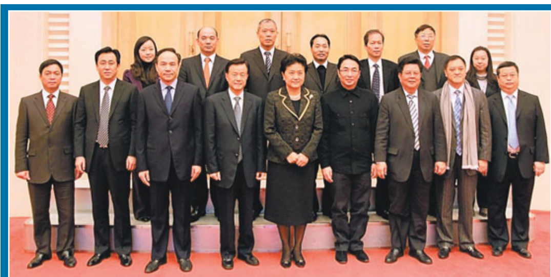
劉延東與新家園協會一行合影留念。

劉延東充分肯定了新家園協會在過去一年半中為推動香港經濟社會發展穩定所做出的突出貢獻，也非常讚賞以許榮茂及李家傑為領導的新家園協會董事會成員，在香港新來港人士領域所做的大量有益工作，及對香港基層人士的大愛之心。她希望香港新家園協會堅定愛國愛港立場，充分發揮自身優勢，密切香港與內地的聯繫。與香港特區政府一起，幫助新來港人士更快更好地融入香港社會，並為香港基層市民的生活出謀劃策，與其他香港居民一道，把香港建設得更加美好。