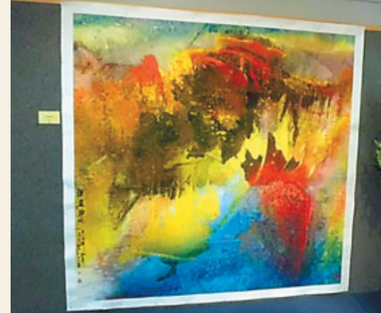
趙道珍作品《深遠幽風》。