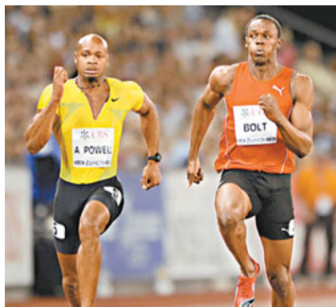
■保特(右)與鮑維將演百米飛人大戰。資料圖片

鑽石聯賽羅馬站上演百米飛人夢幻對決！上年保特在羅馬奧林匹克運動場5萬名觀眾面前，以9秒91力壓同胞鮑維奪冠，今年鑽石聯賽羅馬站觀眾又有機會欣賞這兩名當世飛人的巔峰對決，賽事組委會已確認保特及鮑維將會同場較勁，競逐該站的百米飛人寶座。