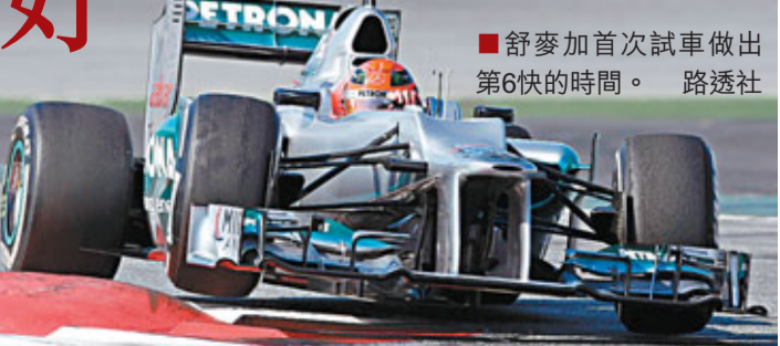
■舒麥加首次試車做出第6快的時間。