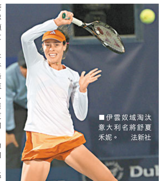
■伊雲奴域淘汰意大利名將舒夏禾妮。