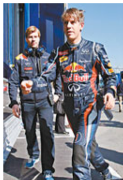
■維泰爾(右)認爲麥拿命仍是今年最大的對手。