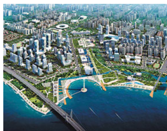
前海將以「前海水城」為核心理念，按照「三區兩帶」規劃結構進行建設。圖為前海設計圖。

香港文匯報訊(記者 李望賢 深圳報導)前海綜合規劃終於獲得深圳市政府通過。根據規劃，前海將以「前海水城」為核心理念，按照「三區兩帶」的城市規劃結構進行建設。在產業導向上，前海將重點發展具備持續創新能力、跨行業並具有產業融合潛力的金融業、現代物流業、信息服務業、科技服務及其他專業服務。