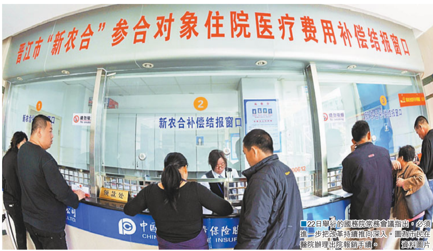
22日舉行的國務院常務會議指出，必須進一步把改革持續推向深入。圖為市民在醫院辦理出院報銷手續。

服務經費標準達到40元以上。在備受關注的社會資本辦醫問題上，會議明確要求，要放寬准入條件，擴大和豐富全