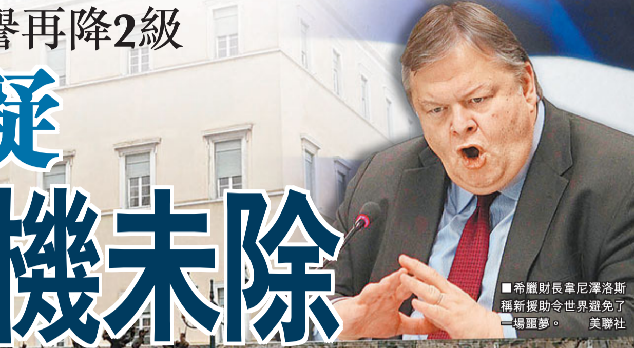
希臘財長韋尼澤洛斯稱新援助令世界避免了一場噩夢。

件，包括裁減公務員、收緊反貪腐法例、準備於6月出售至少兩家國營企業等。 國際貨幣基金組織(IMF)連同新協議發布的一份悲觀債務評估報告稱，於這項「容易出問題」的援希案中，風險平衡點多偏向負面，分析稱IMF得出希臘負債於2020年降至GDP 120.5%的目標太高。一些歐洲官員認為，絕大部分援金會在今年初用掉，希臘4月大選後，歐元區對希臘的影響力或減弱，希臘亦可能被金融市場拒諸門外，意味它退出歐元區的憂慮隨時重新浮現。 法通過7萬億ESM方案 法國下議院前日投票通過歐盟建立「歐洲永久穩定機制」(ESM)的協議，為歐洲應對債務危機建立「防火牆」。ESM將於7月啟動，初始有效融資能力為5,000億歐元(約5.1萬億港元)，為在發債時獲最高信貸評級，其認繳資本將達7,000億歐元(約7.2萬億港元)。 另外，由於匈牙利未能採取削減赤措施，歐盟委員會昨建議明年中止向匈國提供的4.95億歐元(約50.8億港元)發展援助資金，是歐委會首次採取此措施。 ■法新社/路透社/美聯社/《華爾街日報》/英國《金融時報》