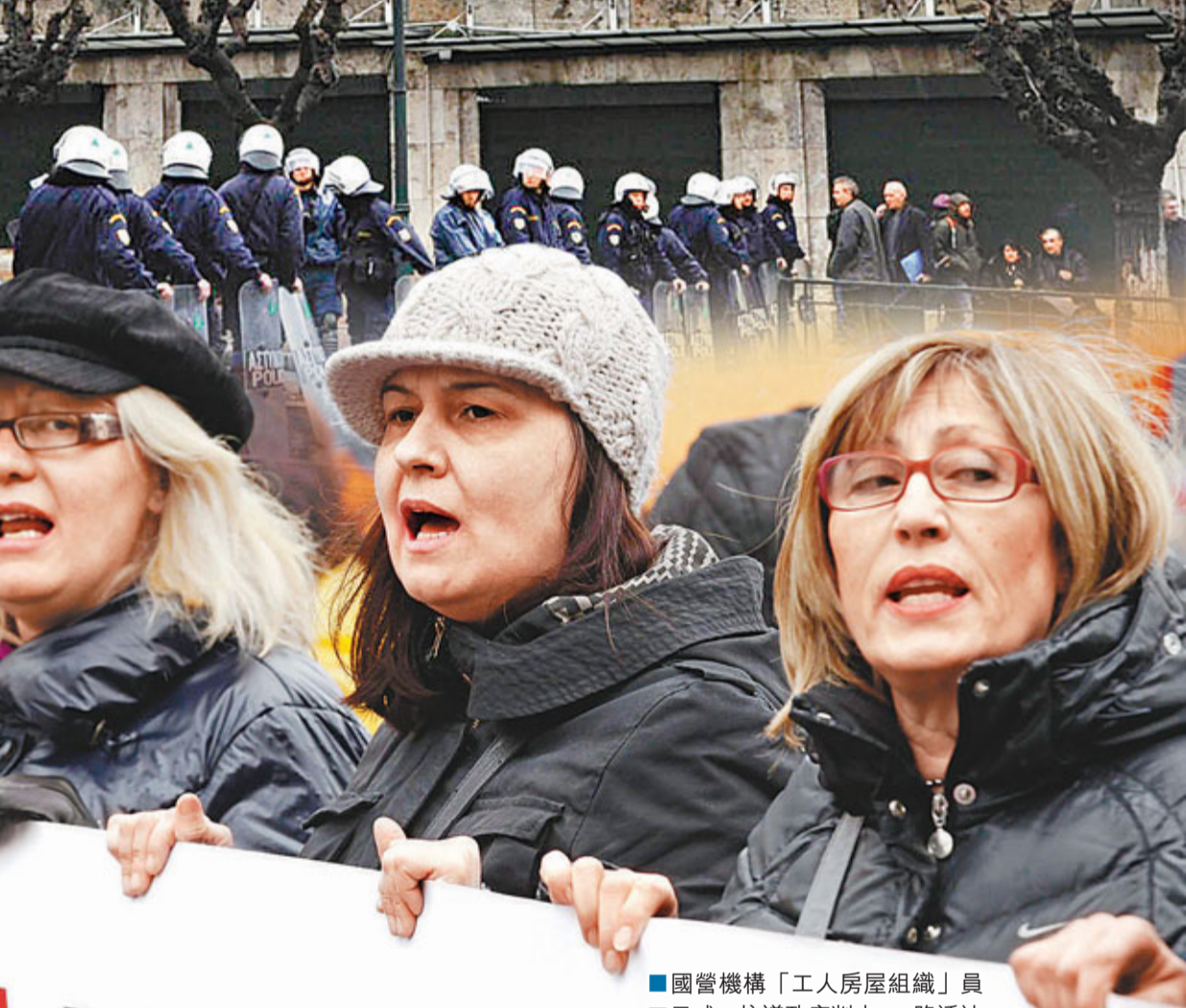
國營機構「工人房屋組織」員工示威，抗議政府削支。

撐緊縮政黨 大選有麻煩 獲批新續命貸款的希臘逃過下月違約命運，但大多數國民不認為希臘已「上岸」，有人認為現在只是達成苟延殘喘的協議，指責政府一直在玩弄政治遊戲，最終會令國家破產。兩大政黨泛希臘社會主義運動(PASOK)和新民主黨極力支持緊縮措施，激起民眾強烈反響，支持度跌至歷史新低，分別僅得19%和13%，要在4月大選爭取國會議席，倍感艱難，但預料 ■法新社/路透社