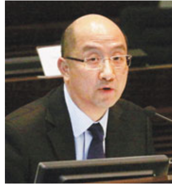
譚志源有信心當局的議席出缺安排可抵禦司法挑戰。

特區政府新修訂的立法會議員出缺補選安排，建議自願辭職議員不得參與在6個月內舉行的補選，事前曾諮詢過法律專家的意見，確保新方案符合《基本法》及其他相關法例的規定。新建議一出，就連一直持反對意見的香港大律師公會，也未有再在其反對聲明中重彈「違憲」的老調。曾策動所謂「公投」、與大律師公會「同一鼻孔出氣」的公民黨，雖失去「違憲」這法寶，仍繼續質疑有關的建議安排。政制及內地事務局局長譚志源強調，當局有信心新建議可以抵禦司法覆核的挑戰。