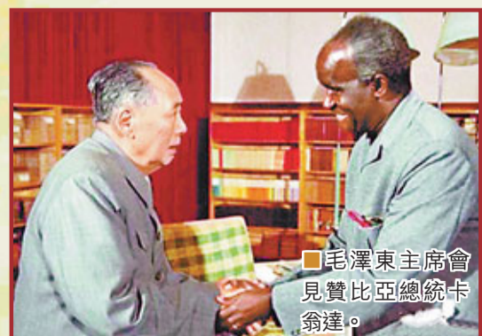
■毛澤東主席會見贊比亞總統卡翁達。

1974年2月22日，毛澤東主席在會見贊比亞總統卡翁達時，提出劃分「三個世界」的理論，號召聯合起來反對霸權主義。毛澤東說：「我看美國、蘇聯是第一世界。中間派，日本、歐洲、澳大利亞、加拿大，是第二世界。咱們是第三世界。」「第三世界人口很多。亞洲除了日本，都是第三世界。整個非洲都是第三世界，拉丁美洲也是第三世界。」毛澤東主席關於劃分「三個世界」的理論，指明了當時國際關係的主要特點。卡翁達總統在北京訪問時談到，中華人民共和國恢復在聯合國合法席位，是中國人民爭取國際承認的