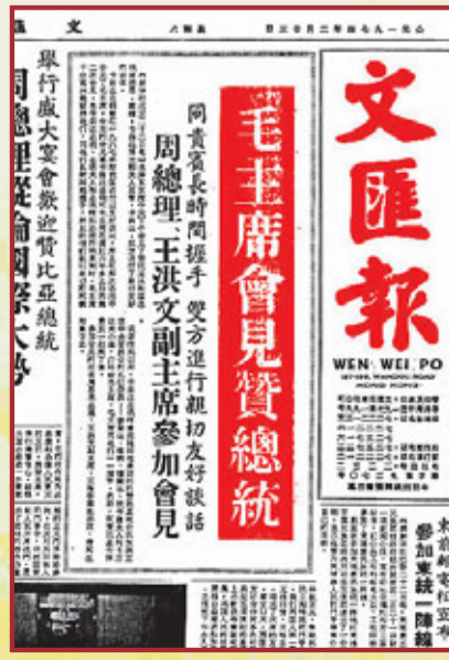
正義鬥爭的最大勝利，這種承認是中國早就應該得到的。中國和贊比亞的關係大大增強，中贊在正義事業的許多問題上相互支持。他感謝中國政府和人民支持非洲及全世界被壓迫者的事業。卡翁達說：「我們世界上有很多朋友，而中國人在我們最好的朋友之列。」