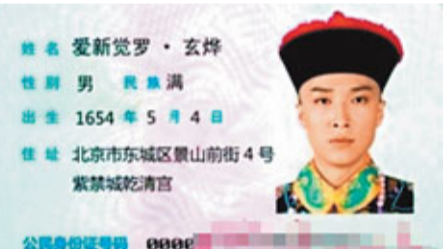
■張先生的「Q版身份證」險些使自己誤網上圖片

20日下午1時，擬乘機前往重慶的張先生來到白雲機場安檢通道，安檢人員在檢查他的身份證時，發現上面的名字竟是「愛新覺羅·玄燁」，照片是穿着龍袍的香港馬姓電視明星。原來，張先生貪圖好玩，在身份證的有國徽的一面粘貼了一張街邊買來的貼紙，上面仿照身份證印着姓名、出生年月、身份證號碼等登記項目，名字竟是已去世兩百多