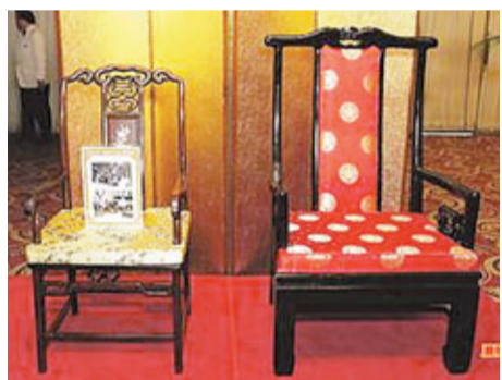
湯加國王國王杜包四世的座椅（右），是一般政要用1.5倍。

至於菜式上的變化，兩蔣時代海鮮少，但餐餐必有大排翅；李登輝時代則除了魚翅外，還多了鮑魚與龍蝦，重視海鮮料理。陳水扁時代則走平民風，首道把碗糗、虱目魚端上桌；至於馬英九則強調節