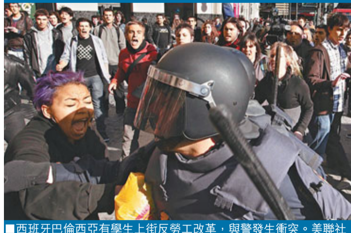
西班牙巴倫西亞有學生上街反勞工改革，與警發生衝突。

歐債危機不斷升溫，區內面臨3年內第2次衰退。英國、荷蘭、意大利和另外9個國家前日聯署去信歐盟，敦促改變策略，將焦點由嚴厲財政緊縮，轉而至刺激經濟增長。此主張明顯和歐元區經濟火車頭德國及法國的看法相左。