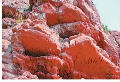
行走於島上彷彿置身於「火焰山」一般