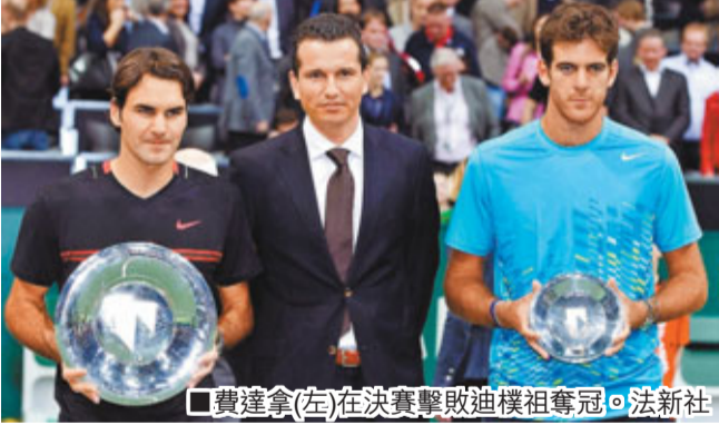
費達拿(左)在決賽擊敗迪樸祖奪冠。

瑞士天王費達拿在19日進行的鹿特丹網球公開賽決賽中，以總盤數6：1、6：4輕取阿根廷名將迪樸祖，捧起個人2012年首座冠軍獎盃。時隔7年再次在這項賽事中捧盃，「費天王」拿歲月開玩笑。費達拿笑着說：「真不敢相信7年之後我才回到這裡，希望下次別讓我等這麼長時間。如果選得等