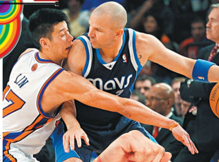
林書豪(左)將傑特比下去。