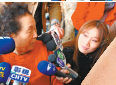
身在彰化的林書豪祖母近2周不停被傳媒採訪。資料圖片