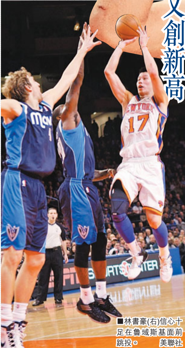
林書豪(右)信心十足在魯域斯基面前跳投。