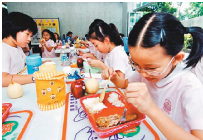
食物安全中心表示，港人攝入的「無機砒」近半來自飯和粥。

香港文匯報訊(記者 嚴敏慧) 食物安全中心昨發表總膳食研究第二份報告，發現檢測的600個食物混合樣本中，51%含有致癌物「無機砒」(俗稱砒霜)，其中以蔬菜(又稱通菜)含量最高，其次是鹹蛋和蠔。中心表示，港人從膳食攝入「無機砒」份量屬中等，但無超出可增加患癌風險水平，無需改變現有健康飲食建議。惟港人攝入的「無機砒」近半來自飯和粥，建議市民煮飯前徹底洗米，並要倒去洗米水，或考慮增加進食其他穀物。