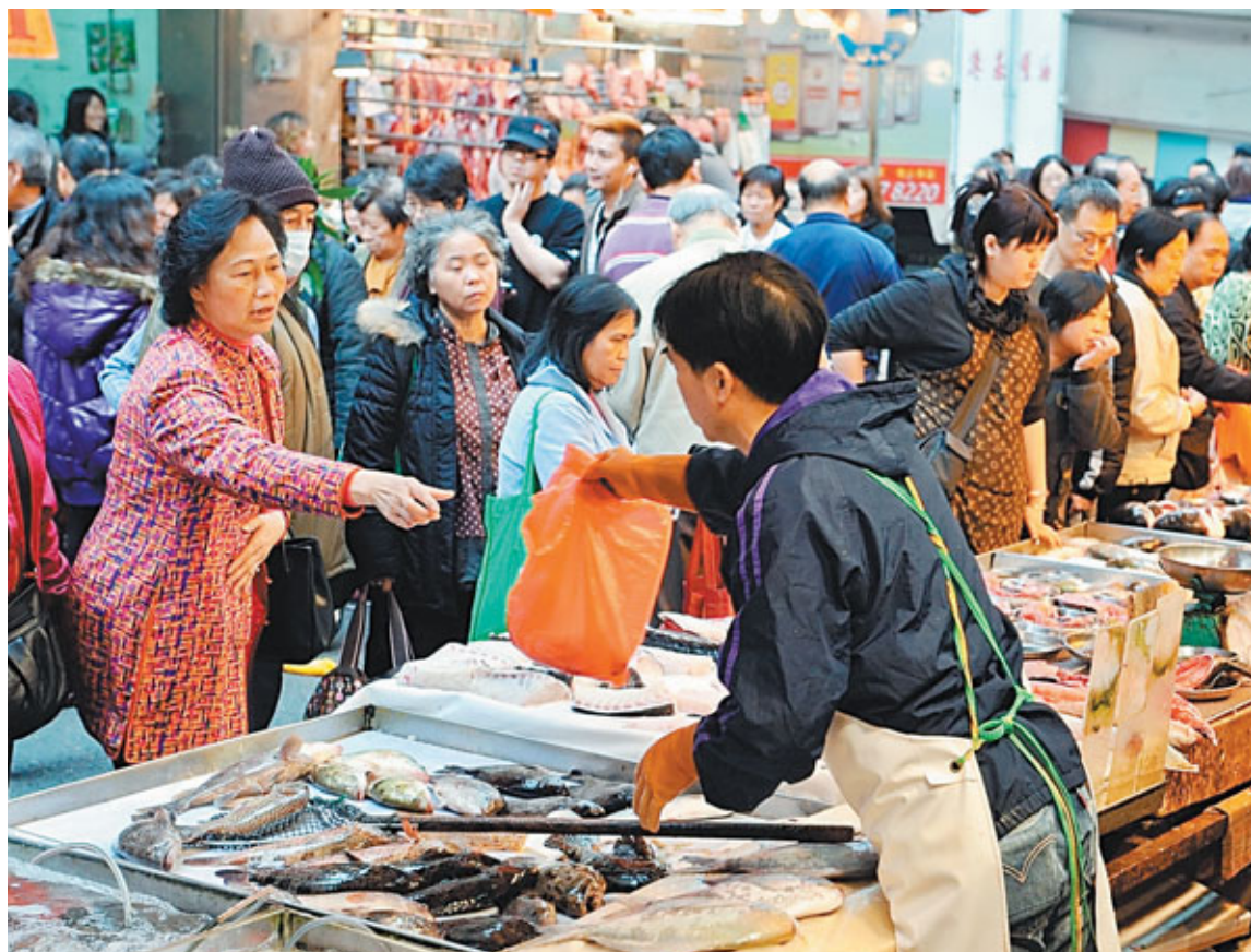
1月份香港消費物價指數同比上升6.1%。圖為市民在市場選購水產品。