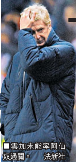
■雲加未能率阿仙奴過關。