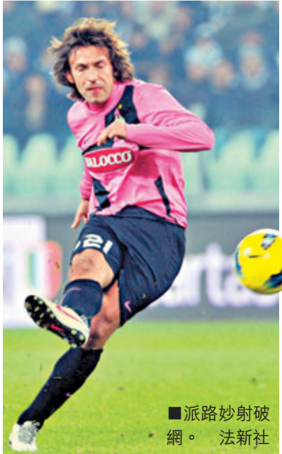
■派路妙射破網。