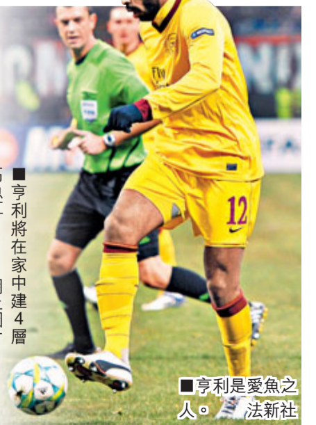
■亨利是愛魚之人。