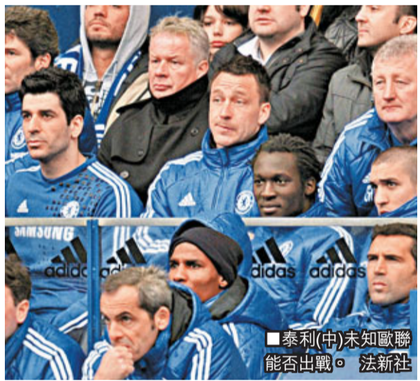
■泰利(中)未知歐聯能否出戰。