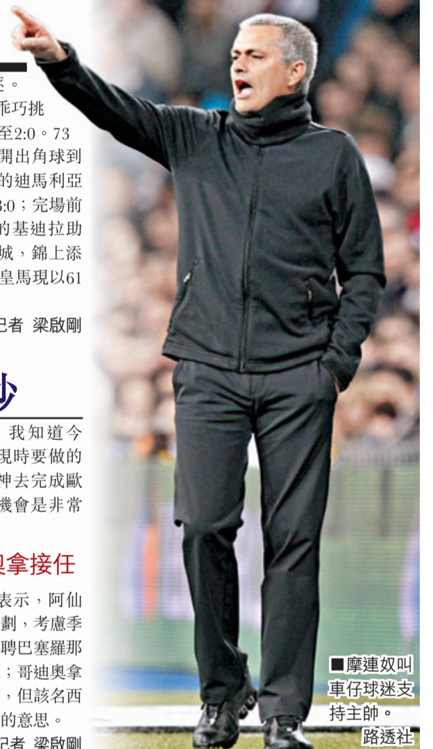
■摩連奴叫車仔球迷支持主帥。