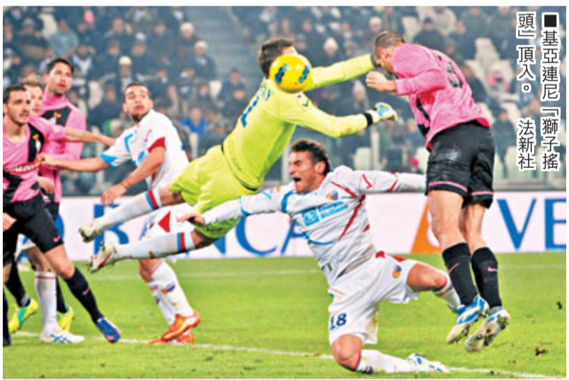
■基亞連尼「獅子搖頭」頂入。