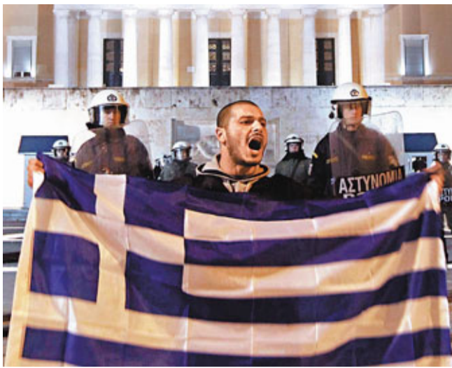
有示威者手持希臘國旗，在國會外叫喊口號抗議。

英國財政大臣歐思邦去年提出200億英鎊(約2,455億港元)貸款保證計劃，由政府借錢予銀行業，再由銀行貸款予中小企，從而振興經濟。但《星期日電訊報》稱，匯控(見圖)指當局收取的借貸息率過高，不打算參加。該計劃將遵照歐盟援助規則，向銀行收取1厘息，另外再收取1厘作轉嫁給貸款者的利息。對蘇格蘭皇家銀行、萊斯銀行較依賴「批發融資」的銀行來說，2厘的息率或具吸引力；但匯豐依靠「存款融資」，該息率相對偏高。據消息人士稱，要所有銀行都參與計劃是「不可能的任務」。英國4大銀行之一的巴克萊銀行據稱提出，政府可列出息率範圍，而非硬性收息2厘。有人則質疑放水救經濟是否有效。英倫銀行最近的數據顯示，銀行業淨貸款額持續收縮，有些銀行的資產負債規模陸續減少，令不少專家質疑是否還需要該200億英鎊。 ■《星期日電訊報》