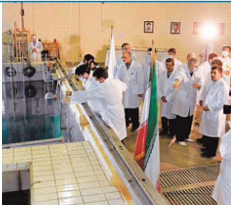
伊朗總統內賈德(右前)參觀德克蘭北部的核反應堆。