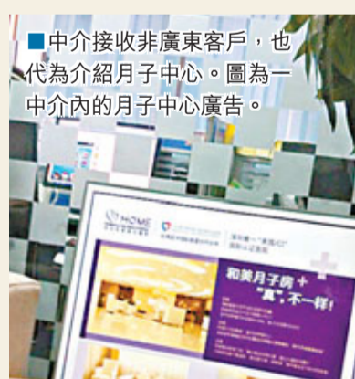
■中介接收非廣東客戶，也代為介紹月子中心。圖為一中介內的月子中心廣告。

龍」收費也日升，普遍較去年同期漲價30%。記者前往羅湖區文錦路一中介公司查詢，工作人員勸記者及早決定，稱價格日日在變，懷孕6周的孕婦前往香港預約，年前價格為6萬元左右，但目前索價8萬元。