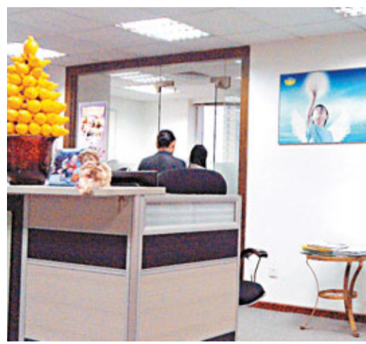
■中介對不熟悉的客戶顯得特別小心，公司裝飾也盡量簡單。