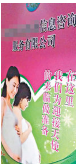
■深圳雙非產子中介近來宣傳廣告不敢「明目張膽」，轉為隱晦。