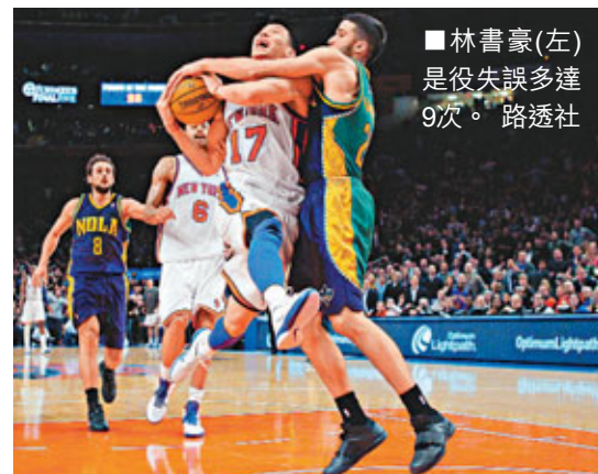
■林書豪(左)是役失誤多達9次。

林書豪今仗受制於黃蜂的聯防夾擊戰術，雖然仍取得全場最高的26分、5次助攻和4次偷球，不過失誤多達9次，加上紐約人外線欠準繩，全隊3分球命中率僅有16.7%，最終在全場落後的劣勢下，以4分之差飲恨。林書豪賽後說：「球隊失利很讓人失望，我本以為這是球隊再勝一場的好機會。主要怪我今天表現不好，處理球有點漫不經心。假如說之前7連勝是得益於我的發揮，那麼這場輸球就絕對是我的責任。」賽後紐約人主帥迪安東尼比較沮喪，認為球員沒有把該投中的球投進，直接給防守