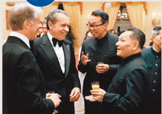
鄧小平訪美期間與卡特、尼克松出席晚宴。