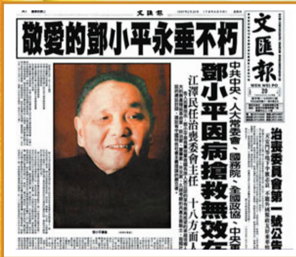
《香港文匯報》當年連續數天刊登鄧公去世消息。

1997年2月19日，全黨全軍全國各族人民公認的享有崇高威望的卓越領導人，偉大的馬克思主義者，偉大的無產階級革命家、政治家、軍事家、外交家，久經考驗的共產主義戰士，中國社會主義改革開放和現代化建設的總設計師，建設有中國特色社會主義理論的創立者鄧小平，因患帕金森病晚期併發肺部感染在北京逝世，享年93歲。2月24日，遺體在北京八寶山革命公墓火化。2月25日，在北京人民大會堂舉行追悼大會，江澤民致悼詞。1997年2月15日，鄧小平同志的親屬致江澤民總書記並黨中央一封信，信中提出，根據鄧小平的囑托，捐獻角膜，解剖遺體供醫學研究。不留骨灰，把骨灰撒入大海。1997年3月2日，鄧小平同志骨灰撒入大海。