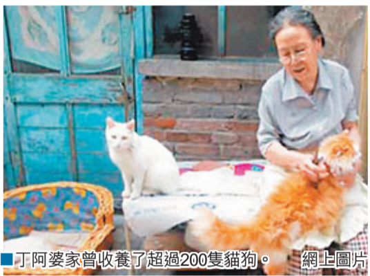
丁阿婆家曾收養了超過200隻貓狗。