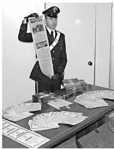
意大利警方展示檢獲的債券。