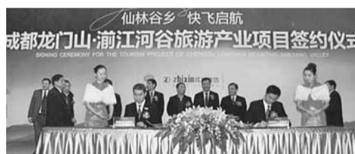
仙林谷鄉國際山地度假區項目簽約儀式現場。

香港文匯報訊（記者 唐宇寧 成都報導）在「5·12」汶川特大地震中受到毀滅性打擊的四川彭州龍門山旅遊產業項目—仙林谷鄉國際山地度假區項目簽約儀式日前在成都舉行，成都置信集團將與彭州市政府合作，投資80億元，打造以休閒度假和山地運動為主的彭州龍門山仙林谷鄉國際山地度假區。