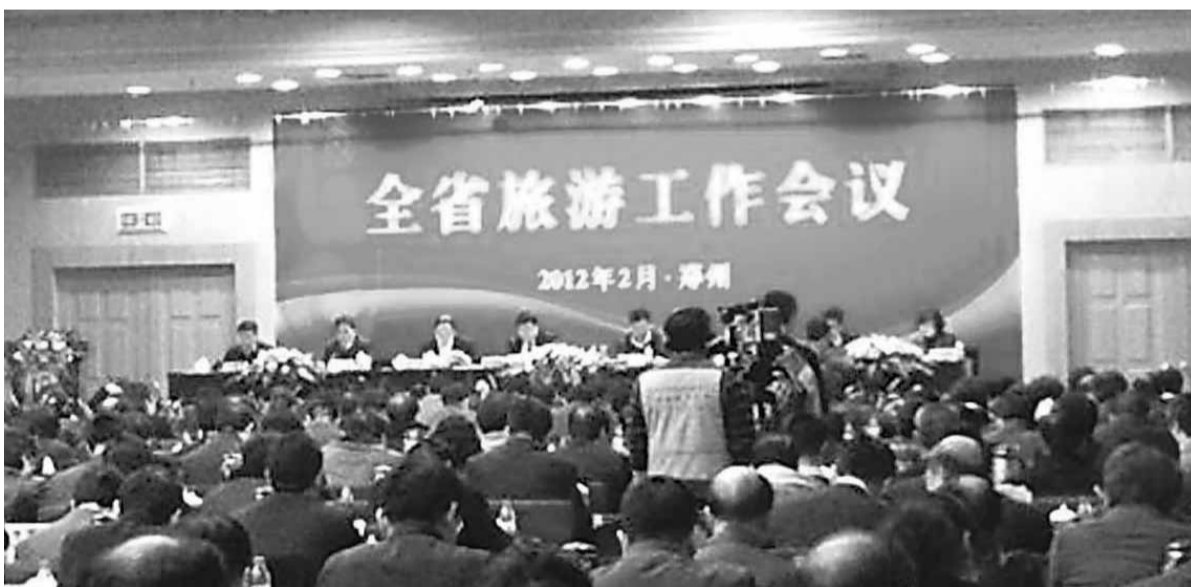
2012年河南省旅遊工作會議現場。

2012年，河南省旅遊工作將重點實施「七大提升計劃」：一是實施旅遊產品提升計劃，持續推動旅遊業轉型升級；二是實施產業融合提升計劃，持續推動旅遊業外延拓展；三是實施市場開拓提升計劃，持續推動旅遊客源結構優化調整；四是實施服務質量提升計劃，持續推動產業發展環境不斷改善；五是實施市場化程度提升計劃，持續推動體制機制改革創新；六是實施人才隊伍素質提升計劃，持續推動旅遊產業向智力密集型發展；七是實施自身建設提升計劃，持續推動旅遊工作方式轉變等，努力把旅遊業培育成國民經濟的戰略性支柱產業和人民群众更加滿意的現代服務業，為中原經濟區建設做出貢獻。