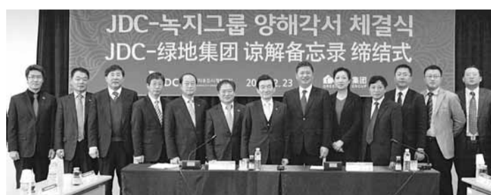
JDC及綠地集團諒解備忘錄締結式現場。

香港文匯報訊 傳說秦始皇曾派遣手下徐福到漢拿山採長生不老草，韓國濟州國際自由城市開發中心(JDC)借此傳說，以「抗老」為主題火熱打造中的「濟州療養村」，近來贏得中國投資者青睞。