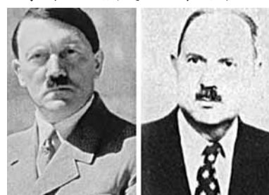
希特勒(左)及私生子洛雷。

膝下無兒的納粹頭頭希特勒原來有後。近日有新證據顯示，第一次世界大戰中希魔被派駐法國時，於1917年6月到小鎮富爾昂昂昂普例行休假，期間與16歲法國少女洛布茹瓦發生關係，誕下一子。