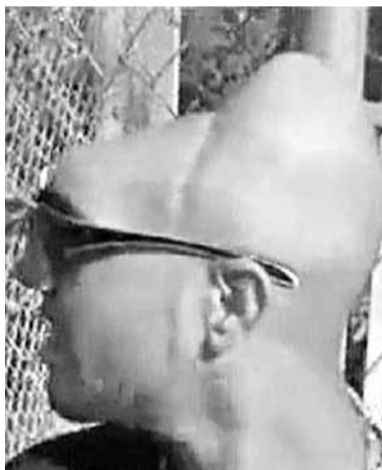
側看：前額和頭頂失蹤