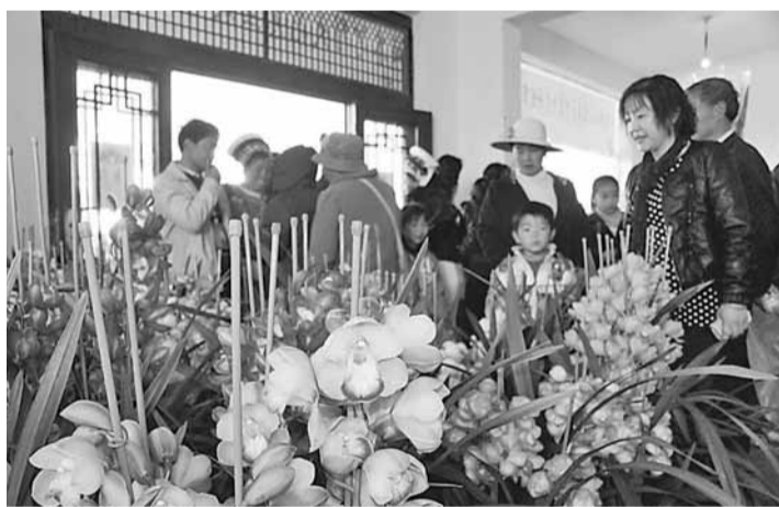
昔日高貴的蘭花品種日漸走入尋常百姓家。

值2億美元。雲南省目前的蘭花存量为1.76億株，養蘭隊伍30餘萬人，從業人員近50萬人，年進入大眾消費市場的蘭花約2,500萬盆。作為雲南省蘭花界龍頭的大理，已登錄為中國名蘭的品種達70多個，是全國最多地區。至2010年底，大理州花卉種植總面積達3,545.9公頃，綜合總