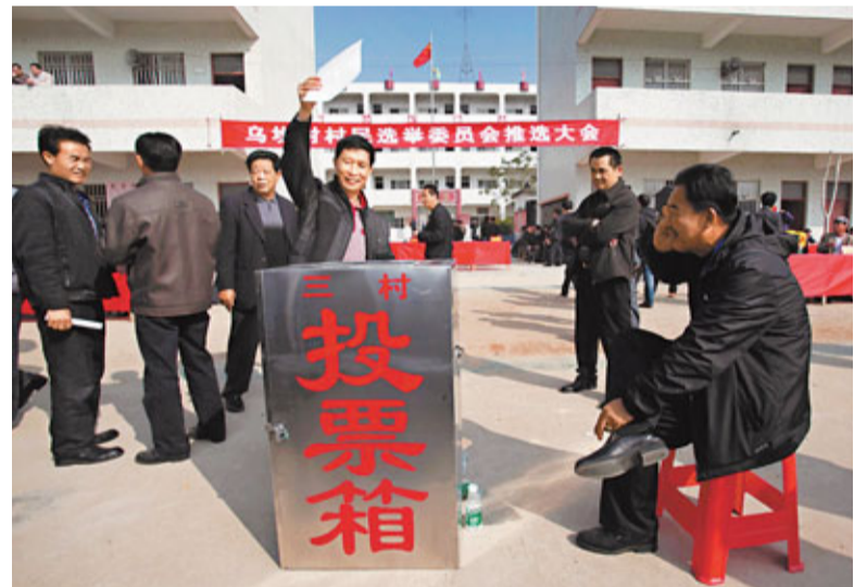
本月1日,烏坎村舉行推選村民代表和選舉村民小組組長大會,選出村民代表和村民小組組長。資料圖片