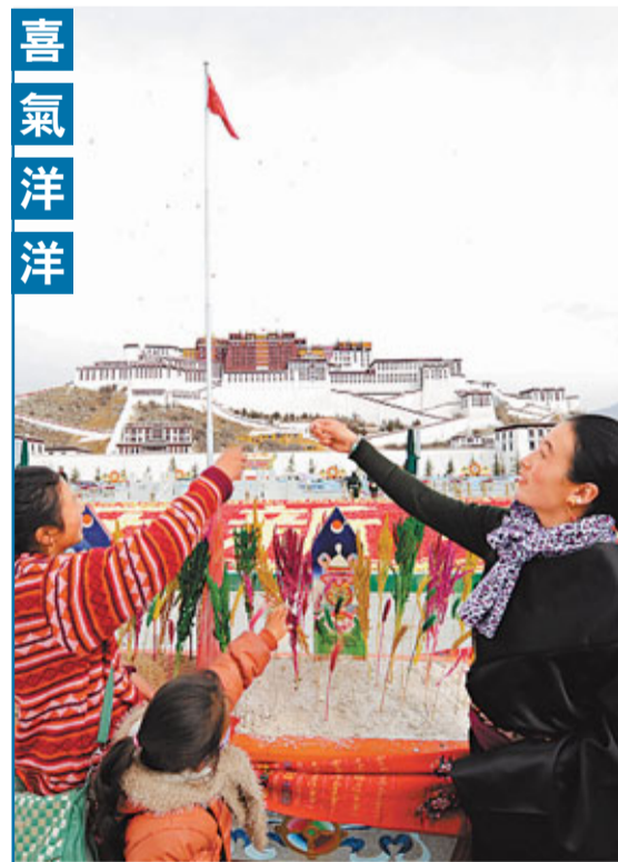
藏曆水龍新年將至,拉薩街頭擺放花飾、張燈結綵,呈現一派喜慶的節日氣氛。17日,幾名藏族姑娘在布達拉宮廣場敬「切瑪」(象徵五穀豐登)。

對於河南省慈善總會一年半沒花出善款,清華大學創新與社會責任研究中心主任鄧國勝認為,只能說明有關機構工作效率低。鄧國勝指出,不能一直把錢放着不用,等着公眾來追問,而且慈善機構應公布捐助信息。