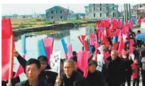
溫州蒼南縣洋河村徵地未給補償,村民聚集表達不滿。

糾紛起因於一個名為臨港產業基地項目的徵地。據當地村民稱,徵地始於2006年,被徵用共6000畝,包括水田600畝、自留地200畝、口糧基地600畝、勞動力地800畝灘塗、海鹽養殖面積4000畝。「除小部分水田,基本上把村裡的地都徵光了。」一位村民代表說,這些土地在村民們不知情的情況下被陸續轉讓,整個徵地過程一直在龍港鎮政府和村委會之間操作。縣政府文件中提到的「每畝16000元」的補助款,村民們也沒有到手一分錢,也未得到合理安置。保命田被收,生計受威脅,隨後上千村民分別在今年2月1日、3日、5日舉行了三場上述「集眾」,選傳說村委會負責人被逐出村,洋河村一度