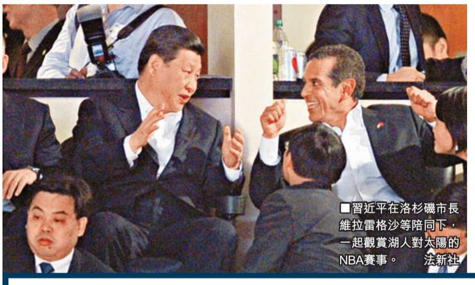
■習近平在洛杉磯市長維拉雷格沙等陪同下，一起觀賞湖人對太陽的NBA賽事。