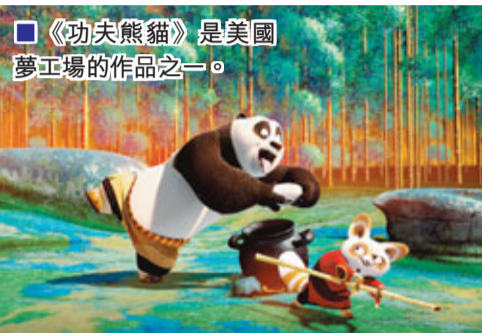
■《功夫熊貓》是美國夢工廠的作品之一。

習近平在離開美國洛杉磯前，觀賞了湖人對太陽的NBA賽事，未有配戴領帶的習近平戴着一副眼鏡看得很投入，也難得的放鬆。國之交，在於民相親。有這樣一個願意接地氣，喜歡接地氣，自然流露着地氣兒的領導人，相信未來，中美民間交流一定會更加頻繁積極。