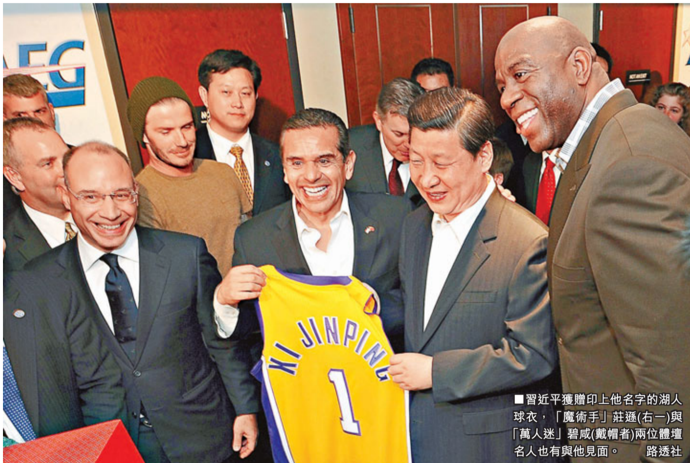
■習近平獲贈印上他名字的湖人球衣，「魔術手」莊遜(右一)與「萬人迷」碧咸(戴帽者)兩位體壇名人也有與他見面。

根據新協議，中國在目前每年進口20部外國電影的配額上，容許多14部3D或IMAX格式外國電影入口，而電影的普通版本不會再在原先的20個配額中重複計算。另外，外國電影公司入口中國的電影，票房分紅由13.5%至17.5%，將增至25%。