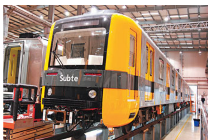
出口阿根廷的首批地鐵車。

香港文匯報訊 (記者 廖一 姚丹) 中國北車長客股份公司研製的阿根廷布宜諾斯艾利斯A線地鐵項目，日前舉行首批車輛發運儀式。車輛外觀黃灰相間，車內黃綠內飾，盡顯潘帕草原風情。首批車輛