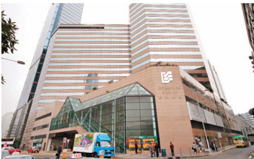
本港1月工商舖摸貨宗數及金額均創近期新低。

儘管東九龍租務市場向好，但投資者對於短線入市始終審慎。本港今年1月寫字樓摸貨買賣合約登記錄得9宗，是2010年3月錄得6宗後22個月以來次低，跟2010年7月及2011年11月的9宗相同。涉及金額錄得1.35億元，是2010年8月錄得