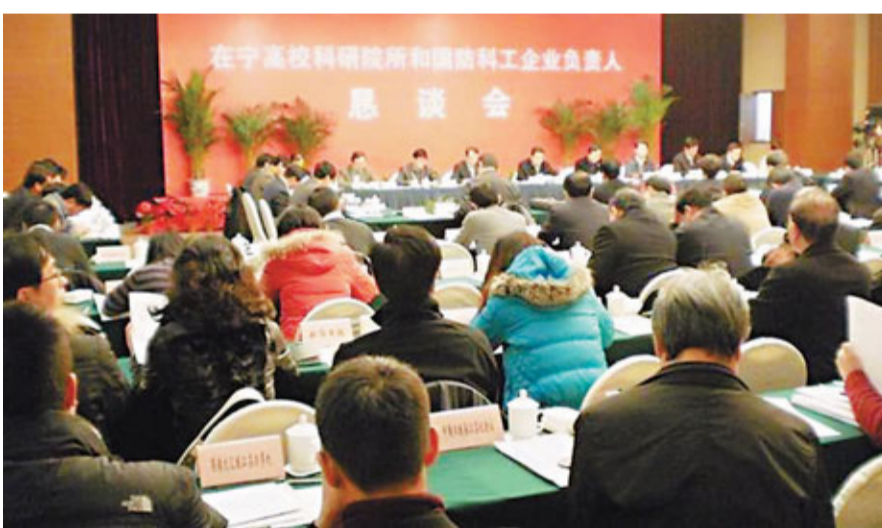
在寧高校科研院所和國防科工企業負責人懇談會現場。

最多95%的比例劃歸參與研發的科技人員及其團隊擁有，明確科技領軍型創業人才創辦的企業中知識產權等無形資產按至少50%、最多70%的比例折算為技術股份，明確在高校、科研院所以科技成果作價入股的企業、國有控股的院所轉制企業、高