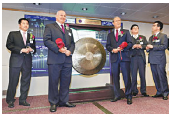
易亞4隻新ETF昨日掛牌。扮演美國前總統小布什開名的美國演員Steve Bridges(右三)與易亞投資行政總裁杜比(左二)一同敲鑼。

價格以招股範圍的低位1.6元定價,相當於13.5倍2012年度市盈率,集資4億元。該股將於本月23日掛牌。