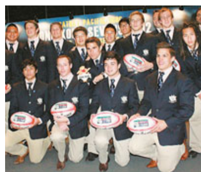
■港隊被抽中與國家隊、東加和烏拉圭同組。齊為首次登場的紅色龍寶寶改個可愛名字。

昨日港隊所有隊員齊現身抽籤會場，為賽事壯聲勢。與此同時，今年欖球賽的吉祥物亦首次現身於香港大眾面前，為欖球賽作宣傳，市民可齊