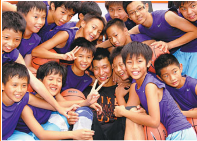
■林書豪去年在台灣已深受小球迷歡迎。