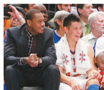
■安東尼(左)重申不是自私球員。美聯社

正在養傷的安東尼預料可在短期內復出，在大勝帝王一役，更曾在後備席坐在林書豪身旁說笑，沒有傳言影響雙方關係，林瘋對此表示：「我們在談當他復出時，我們有多興奮。」