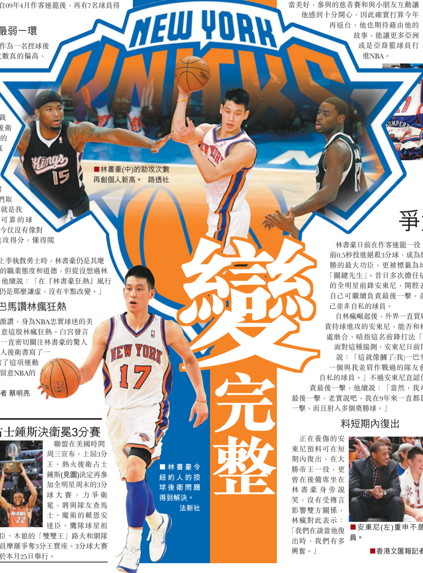
■林書豪(中)的助攻次數再創個人新高。