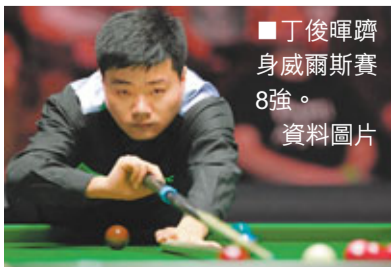
■丁俊暉躋身威爾斯賽8強。資料圖片

丁俊暉開局先以單桿65分和76分連奪2局，不過3屆賽事冠軍希堅斯其後一口氣連下3局，以總局數3:2反前，率先拿到賽點。戰至第6局比賽，雙方均有失誤，但小丁把握希堅