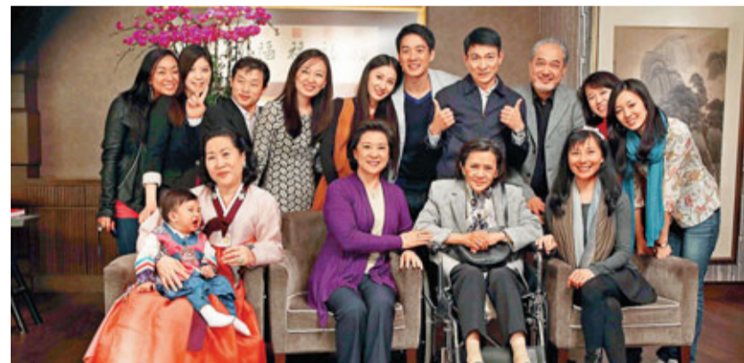
《桃姐》其中一幕講述兒孫滿堂的情景，惟小演員不合作地大哭起來。

與小演員的互動後，華仔有感而發地說：「我鍾意小朋友，但我覺得時下的父母只會驕縱自己孩子，而不懂得如何教導他們！我雖未為人父母，但眼見身邊的朋友那種驕縱子女的態度，實在有點兒看不過眼。小朋友哭乃平常事，哭累了，便會自動收聲，睡也好，玩也好，總之就不哭。但當他哭鬧的時候，你千方百計地哄他，那就等同驕縱他了。因為他慢慢學會想要甚麼，只要一哭，大家便會給他，時下大部分父母就這樣犯了這毛病。」