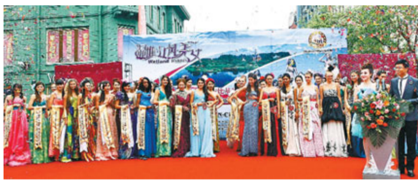
哈爾濱是一座開放時尚的城市。圖為國際城市比基尼小姐大賽在哈成功舉辦。

香港文匯報訊(記者 王欣欣)近年,哈爾濱確立了「城市即旅遊、旅遊即城市」的大旅遊發展概念。冬季冰雪遊、夏季生態濕地遊將「冰城夏都」的名號叫響海內外。2011年香港到哈旅遊的人數達1.4萬人,港商在旅遊地產、賓館及服務業都有廣闊的投資空間。