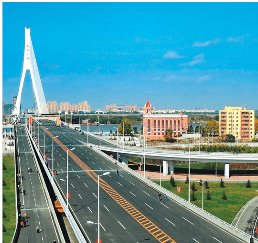
哈爾濱機場、地鐵等城市基礎設施建設正如火如荼,給港商帶來了巨大投資發展空間。