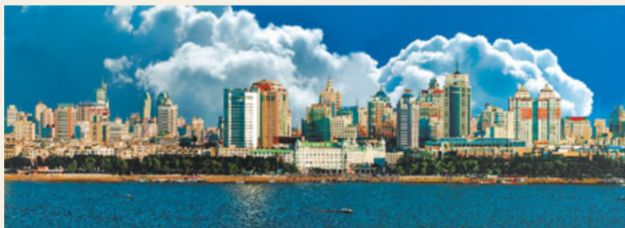
哈爾濱市政府代表團赴港開展經貿交流活動,哈市快速發展的成果吸引港商目光。

一是將提供更加優惠的支持政策。「十二五」期間,國家繼續支持東北老工業基地振興,作為國家現代服務業綜合改革試點、水生態保護與修復試點、創新型城市試點,哈爾濱將在產業升級、科技發展、民生保障、基礎設施建設等方面獲得更多支持。黑龍江大小興安嶺生態功能區已上升為國家戰略,哈爾濱所轄的巴彥、木蘭、通河等縣都在政策區內,將在林區體制改革、生態環境保護、經濟轉型等方面獲得國家和黑龍江省的大量資金支持。圍繞鼓勵外資和民間資本參與的產業項目和園區建設,該市在政府服務、財稅支持、土地使用、權益保護等方面也出了一些政策,對於重大項目將「一事一議」,給予更大力