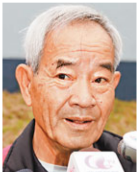
村民指出,今後當局在沙頭角墟入口設置新的檢查站,反令他每次出入時均需出示「禁區許可證」。

香港文匯報訊(記者 聶曉輝)港府縮減禁區範圍,本可令不少原居民及在舊有禁區工作的人士,今後可自由出入,但居於沙頭角墟水坑村的邱先生卻指出,由於其住處及沙頭角墟與中英街一帶過往同為禁區,他可自由往返沙頭角墟的街市買菜及使用區內設施,今後卻因為當局在沙頭角墟入口設置新的檢查站,令他每次出入均需出示「禁區許可證」。他認為當局應將沙頭角墟及中英街一併釋出禁區範圍。此外,亦有居民擔心舊有禁區範圍今後將有更多閒雜人出入,影響治安。