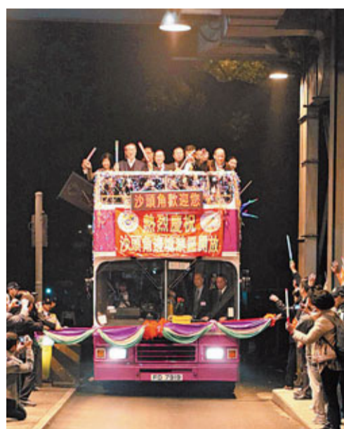
石涌凹檢查站二月十四日午夜十二時關閉及一號口檢查站同時啟用。唐英年、劉皇發等出席禁區開放儀式。