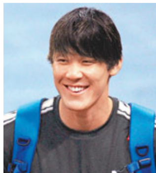
朴泰桓將於周四參加畢業典禮。

另外，朴泰桓去年在教練建議下轉攻短程項目，不過日前在悉尼的一場公開賽中，再度出戰男子1500米自由泳，並以14分47秒38的成績奪冠，較個人在06年多哈亞運會創下的14分55秒03韓國新紀錄快7秒65，連同在早前的男子400米和200米自由泳金牌，成為賽事的「3冠王」。■香港文匯報記者 蔡明亮