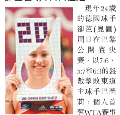
卻芭在巴黎公開賽決賽中奪冠。

現年24歲的德國球手卻芭(見圖)周日在巴黎公開賽決賽，以7:6、5:7和6:3的盤數擊敗東道主球手巴圖莉，個人首奪WTA賽事冠軍，並繼1995年的名將嘉芙後，成為首名奪得該項賽事的德國球手。卻芭在這項賽事前，從未擊敗過世界排名前10位的球手，但在8強卻將世界排名第2位的舒拉寶娃淘汰。