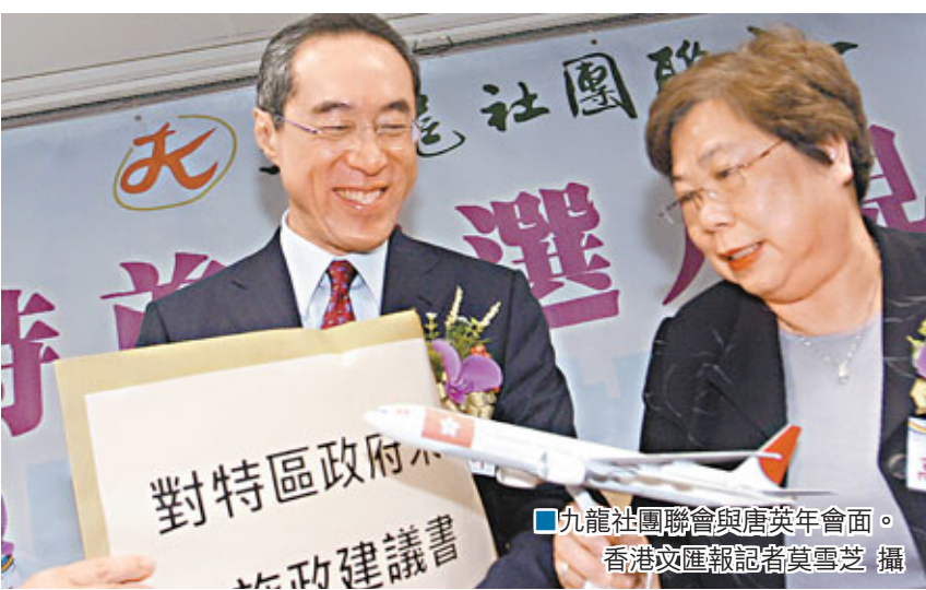
九龍社團聯合會與唐英年會面。

特首提名期前夕，涉及兩名「熱門」特首參選人的負面消息越來越多。有報章報道，特首參選人唐英年位於九龍塘的大宅，涉嫌經過僭建以興建地下酒窖，更質疑唐英年在接受該報查詢時拒絕承認事實，有故意隱瞞之嫌。唐英年相信問題在於雙方出現溝通誤會，強調「做男人要有膊頭，做公職要有腰骨」，自己有錯定會承認，又透露自己早前已安排合格人士視察有關的僭建物，並會敦促承辦商盡快糾正，又對有關的修正工作緩慢表示歉意。