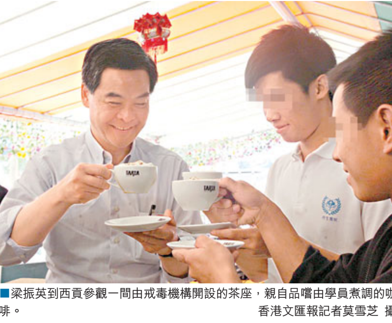
梁振英到西貢參觀一間由戒毒機構開設的茶座，親自品嚐由學員烹調的咖啡。香港文匯報記者莫雪芝攝。

香港文匯報訊（記者 鄭治祖）特首參選人梁振英再被問及西九規劃設計比賽所引發的風波時，強調公職人員的誠信非常重要，並要求政府公開當年的所有檔案，讓公眾清楚各公職人員在是次事件上的角色。 梁振英昨日在一公開活動後重申，他及自己曾主理的戴德梁行，均沒有參與西九設計比賽，而參與是次比賽的2間建築事務所及1家供料測量師事務所，亦已表明他及其公司均非參賽團隊一分子，又重申自己與其他評審成員一樣，並不知道百多份參賽作品所屬的團隊身份。 他坦言，倘自己或戴德梁行與參