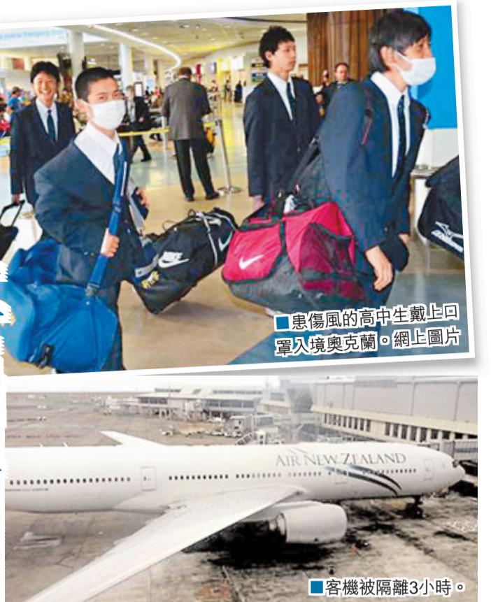
患傷風的高中生戴上回國入境奧克蘭。網上圖片