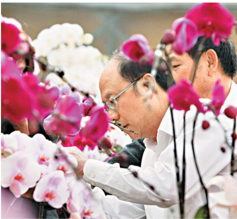
■鄭立中13日參訪台南市，在鹽水區的蘭園嘗試如何育種。

談及兩岸經貿關係，鄭立中提到，台灣在過去一年的兩岸經貿中獲得700億元的順差，這與ECFA早收清單有密不可分的關係。但在今年及未來，早收清單將進一步發揮作用，因為被列入早收清單中的569項產品，大多自今年1月1日開始實施零關稅，農產品也只剩兩項仍需徵收5%關稅，