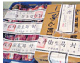
■當局一共封存35公斤肉品。

據瞭解，目前全球有26個國家規定可合法使用萊克多巴胺，多為肉品出產國；但有160多國禁用。台灣也規定所有肉類產品不可檢出瘦肉精。