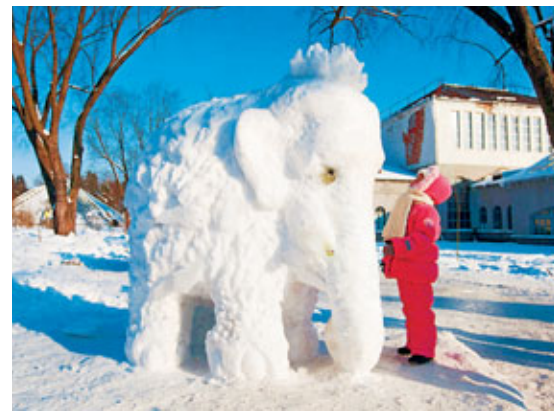
白俄民眾好奇地看著用雪砌成的大象。

嚴寒天氣持續籠罩歐洲，至今已造成超過550人凍死。科索沃南部一山村前日發生雪崩，至今造成7人喪生；波蘭則發生暖氣設備故障，導致多人死傷。當局估計，巴爾幹半島國家超過11萬人因為風雪與外界交通中斷。多瑙河持續結冰，數百公里水路交通中斷；意大利有農業組織稱，大量蔬果和肉類產品不能運到市場，約10萬噸食品腐爛。