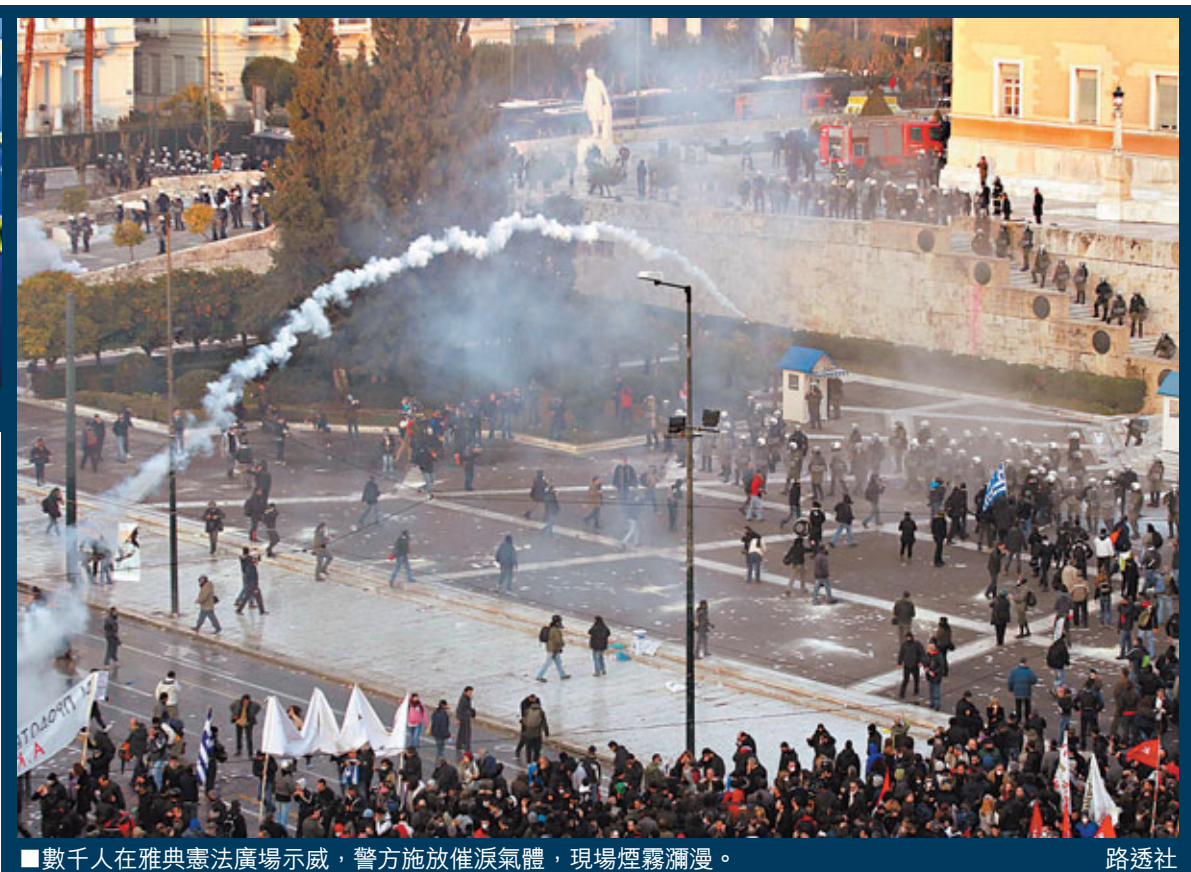
數千人在雅典憲法廣場示威，警方施放催淚氣體，現場煙霧瀰漫。

希臘國會須通過新緊縮措施，以獲得歐盟等機構1,300億歐元(約1.33萬億港元)援助貸款，預計國會辯論於香港時間今晨6時結束，其後表決緊縮措施。總理帕帕季莫斯前日呼籲議員負起「歷史責任」，否則國家將面臨「災難性後果」，甚至被迫退出歐元區。連續多日示威的希臘民眾昨日包圍國會反緊縮，抗議國家被踐踏在「德國靴子下」。