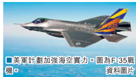
美國軍計劃加強海空實力。圖為F-35戰機。資料圖片

美國總統奧巴馬今日向國會提交2013年度預算案，集中向富人及企業加稅，更提出向華爾街大行徵收為期10年、總值610億美元(約4,731億港元)的「金融海嘯責任費」，意味兩黨在大選年的預算之爭一觸即發。另外，新財年國防預算的科研採購開支將為1,788億美元(約1.4萬億港元)，比預期