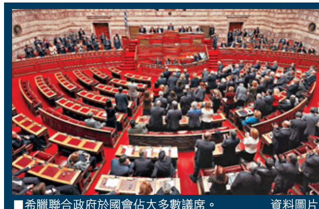
希臘聯合政府於國會佔大多數議席。資料圖片