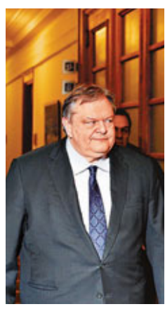
歐元區財長「圍剿」韋尼澤洛斯。法新社

希臘民眾認為新緊縮方案過度苛刻，上周先後爆發兩次大規模罷工，數千名示威者昨日包圍國會向議員施