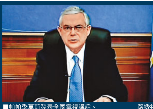
帕帕季莫斯發表全國電視講話。