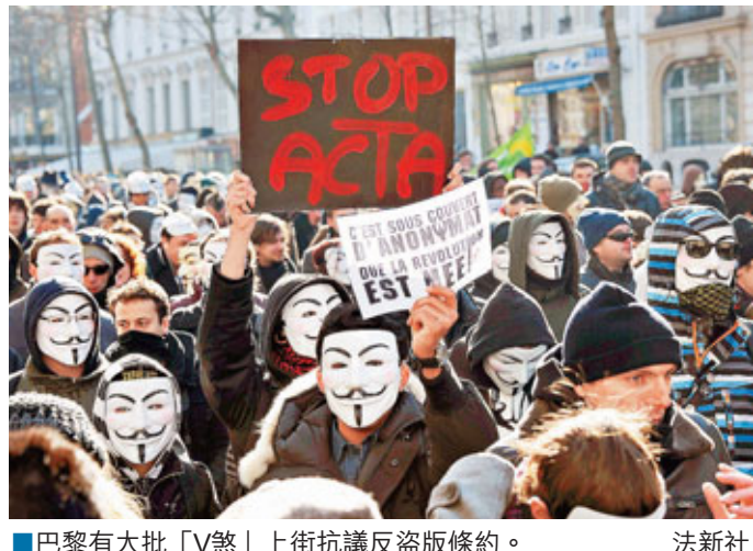
巴黎有大批「V煞」上街抗議反盜版條約。

有示威者稱，ACTA部分條款含糊不清，能作多種闡述，可能改變人權及盜版的定義，而且不能回頭，因此絕不能通過。保加利亞甚至有大批音樂家示威，他們稱即使犧牲版權收入，也要維護網絡自由。部分民眾於社交網站facebook發起捐血抗議，稱血液是生命之泉，與網絡資訊一樣，捐血象徵分享資訊並非罪行。