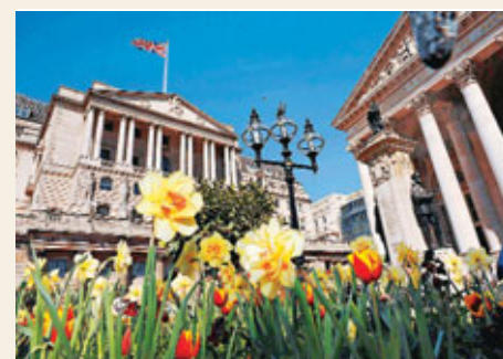
英倫銀行(見圖)上周宣布推出新一輪量化寬鬆措施(QE)，成效如何仍有待觀察，但因英國國債價格近日大幅上升，大舉印銀紙便令央行「豬籠入水」，賬面淨賺逾400億英鎊(約4,888億港元)。

在QE實施下，英倫銀行將大印銀紙，以購入更多政府債券。自2011年7月起，英國10年期以上債息大跌近1厘，從約3厘跌至僅高2厘，亦即央行現時持有的國債價格上升。購買資產計劃所賺取的收益最終會回饋庫房。