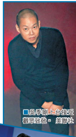
吳季剛上台接受觀眾致敬。美聯社

吳季剛今次共派出42位模特兒演繹其設計，他形容挑選和為她們裝扮的過程是藝術多於科學，但並非沒公式可以依循。他考量模特兒的身高、頭髮、體態、笑容以至步姿，像御用模特兒克洛步履緩慢略帶倨傲，最適合演繹點題之作。 ■美聯社/法新社