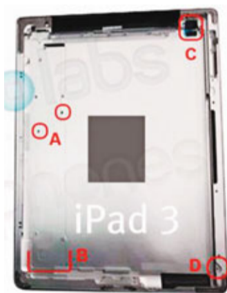
網上流傳據稱是iPad3的照片。