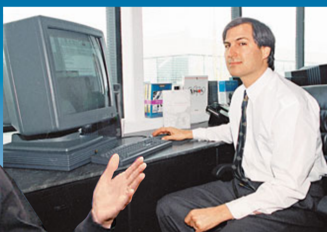
喬布斯於1991年與NeXT電腦合照。