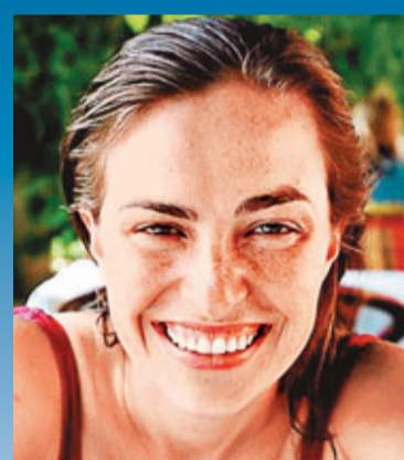
喬布斯一度不承認親女莉薩。