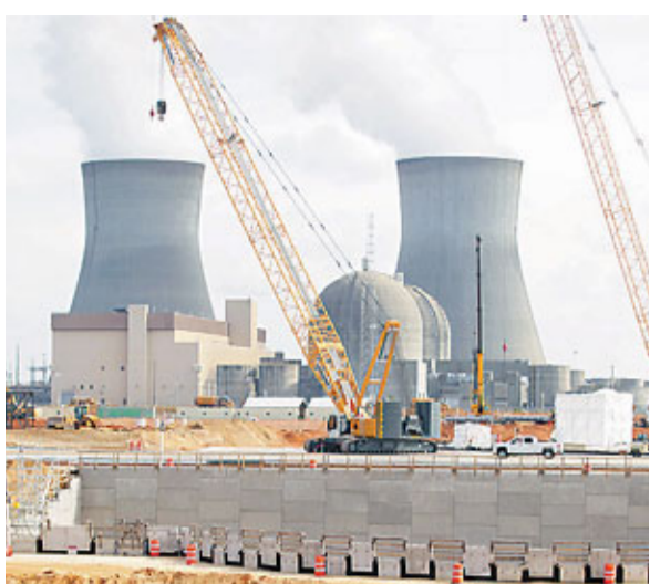
弗格特勒核電站已擁有兩個核反應堆。