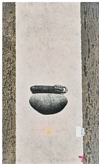
■薩文高東義(泰國)的作品。