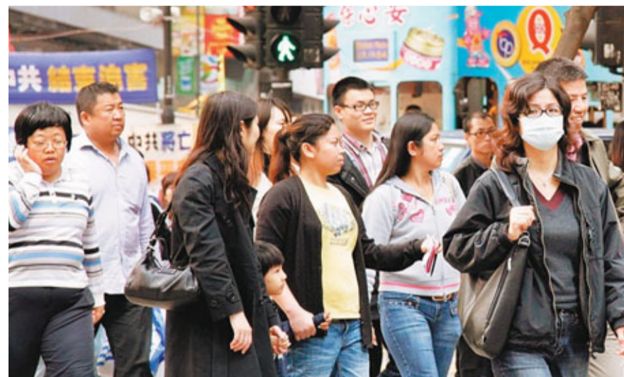
本港進入流感高峰期，疫苗對「山形」乙型流感效用不大，但大規模爆發的機會不大。

公共衛生檢測中心檢測334個流感病毒樣本，發現當中有232個樣本屬乙型流感病毒，98個是甲型(H3)病毒，4個是甲型流感病毒，乙型流感病毒佔69.5%。香港大學微生物學系助理教授黃世賢表示，目前流行「山形」及「維多利亞」乙型流感病毒，「山形」更有上升趨勢，但香港採用的流感疫苗配方主要針對「布里斯本」乙型流感，疫苗的保護力被大折扣。換言之，市民即使打了疫苗，若遇上「山形」或「維多利亞」型乙型流感病毒，也有機會「中招」。儘管疫苗對流感病毒保護力欠佳，但他認為大規模爆發流感的機會不會因此增加，呼籲市民注意個人衛生，高危一族應減少到人多擠迫的場所。