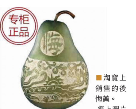
淘寶上銷售的後悔藥。

也許是價格便宜又新奇，「後悔藥」的銷量還真不少，銷量最高的已經成交了40筆，大部分的配圖是一個葫蘆形狀的瓶