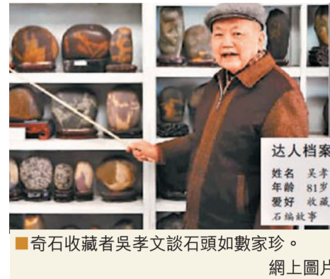
吳老收藏的奇石如數家珍。

走進位於新牌坊的吳老家。這套約130平方米的居室裡，臥室、客廳，甚至陽台上都有奇石，儼然一個奇石博物館。