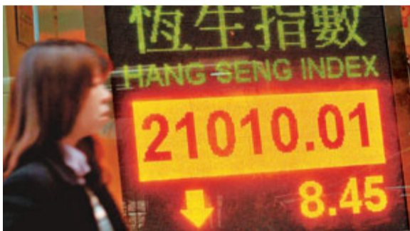
▲港股昨三度觸及250日線，成交增至903億元。

香港文匯報訊(記者 周紹基) 港股正值牛熊交戰的關鍵時刻，昨日大市在牛熊分界線上下爭持，出現「三上三落」的局面。市場人士認為，大市再攀升的機會甚大，因為很多基金與投資者尚在「場外」觀望，如果他們入市，有能力將恒指推上21,800點，唯一的顧忌是恒指去年累跌20%，但踏入2012年，短短一個月就急升14%，收復了去年大部分失地，故此「先調整，後突破」似乎是二月份的大市形態。