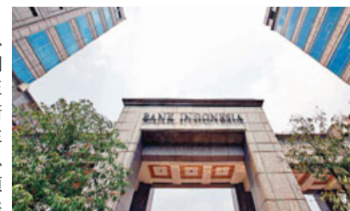
▲印尼央行昨日意外宣布減息1/4厘。

印尼央行昨日意外宣布減息1/4厘，基準利率由6厘降至5.75厘的歷史新低，是3個月來首次。今次減息決定大出市場預期，央行則表示，環球經濟倒退會損害該國增長，加上通脹稍為放緩，故有空間減息刺激經濟。