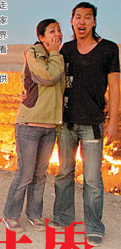
土庫曼的鬼門關遠看是一片火海，這裡的天然氣可算是這個地方最珍貴的財產。

築夢從來都不簡單，尤其在香港。對於那些爭分奪秒的人來說，300多天若換算成金錢，這是一筆難以估算的財富，對於普通上班族來說，300多個日子可能等於三分一的首期，那麼這對夫婦可吃虧了！但他們每人只花了大概十萬元，卻在旅途中得到無數的人情、無邊的光彩及無限的回憶，還有圓了一個夢，對他們來說，賺到了。