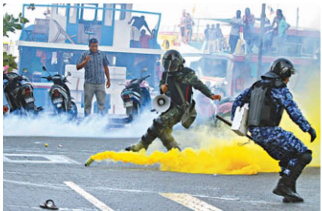
■納希德支持者向警員擲回催淚氣罐。 威，總統納希德試圖協商已晚，人民抗議讓總統不得不下台。