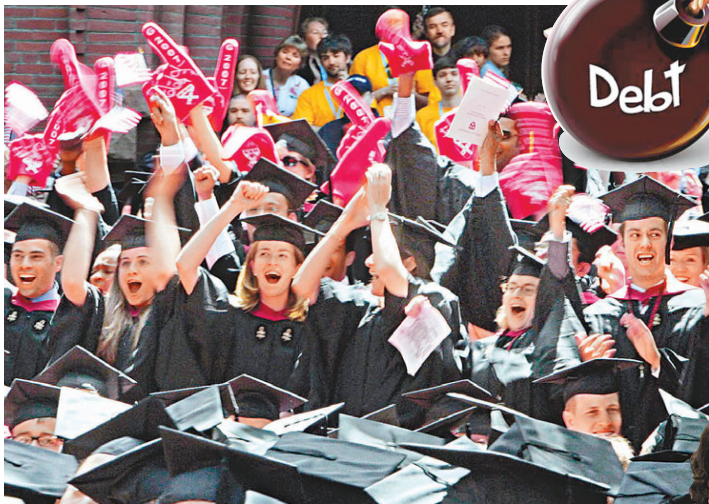
■美國因學債申請破產的人數急增。圖為哈佛商學院的畢業典禮。