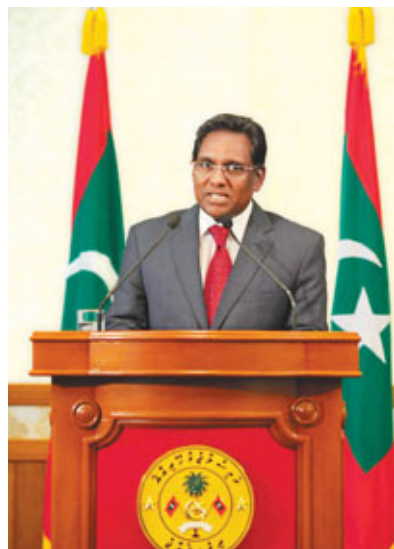
■哈山就任新總統。

馬爾代夫發生警察嘩變後，副總統哈山正式接任總統，他強調將繼續尊重民主法治，稱將組建「民族團結」新內閣，並歡迎前執政黨馬爾代夫民主黨(MDP)加入。剛下台的納希德昨日率領數千名支持者，在首都馬累軍警總部旁的廣場抗議，示威者向警員擲石，軍警施放催淚氣和胡椒噴霧驅趕，據報納希德被警員毆打。鑑於馬爾代夫的最近情況，香港特別行政區政府昨日對馬爾代夫發出黃色外遊警。