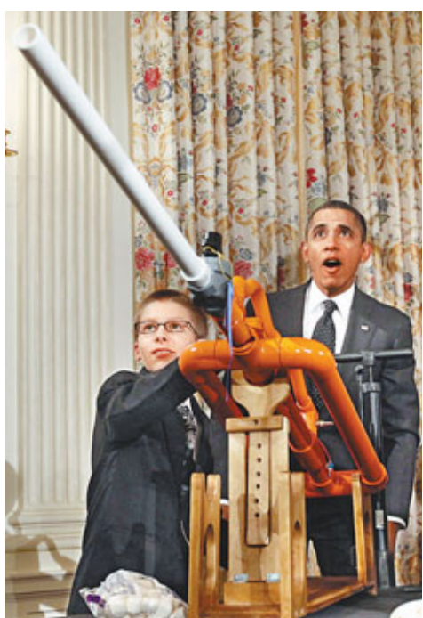
■奧巴馬玩棉花糖炮開心到「O嘴」。