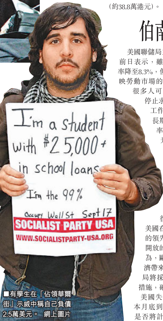
■有學生在「佔領華爾街」示威中稱自己負債2.5萬美元。 網上圖片

美國矽谷聯網及矽谷社區基金會前日公布去年的「矽谷指數」，顯示當地就業率有明顯復甦跡象。雖然當地失業率為8.3%，與全國失業率相同，但也較加州失業率的10.9%為低。根據報告，除了製造業未有增長外，其餘行業都錄得增幅，當中主要為高科技行業，如雲端運算、手機裝置、手機應用程式、互聯網公司及社交媒體。 ■法新社/美聯社