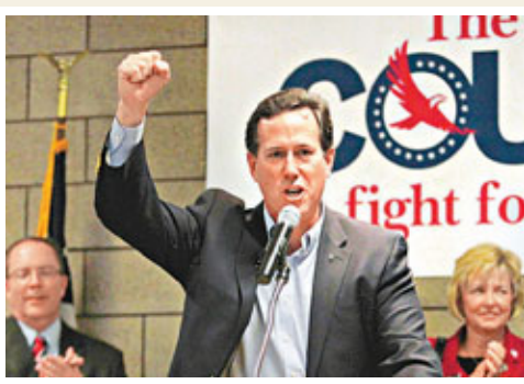
■桑托勒姆盡顯黑馬本色。

周二晚的結果也讓自艾奧瓦州後未嘗一勝的桑托勒姆，有機會在3月6日「超級星期二」前重整旗鼓，提升競選團隊資金和實力，挑戰羅姆尼的領先地位。他在密州發表勝利演說，強調自己不單是羅姆尼，更是總統奧巴馬以外的「保守派選擇」。