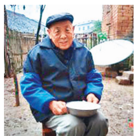
■陽朔縣的老人手捧疑為致病禍首的鎘米。