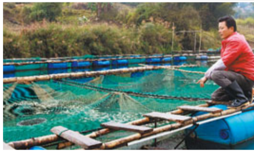
■龍江鎘污染事故，共涉及養殖戶237戶。中新社

而發生爆炸的廣維集團職工陳女士也透露，爆炸後雖然已停產，但停產前在生產過程中產生的含有硫化物的廢水，往往就通過地下排水系統偷偷排到河中。