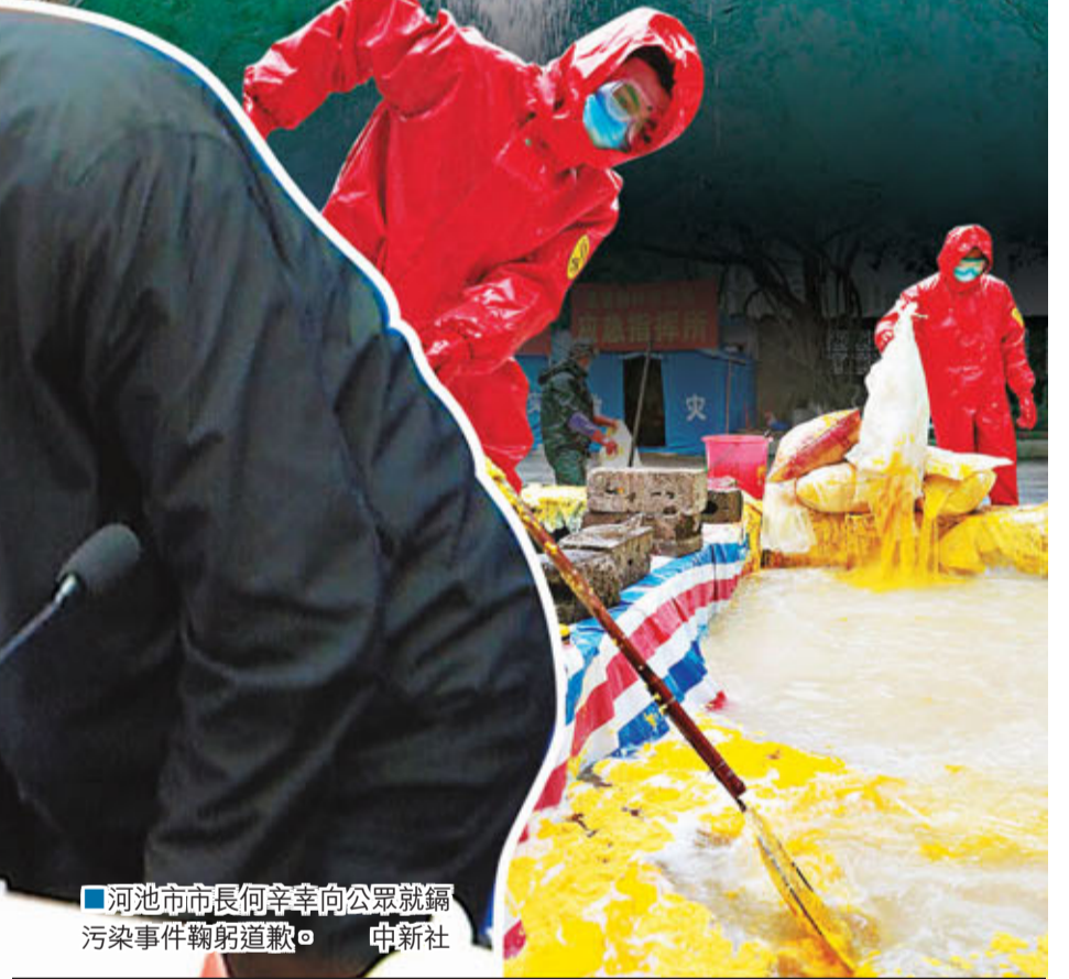
■河池市市長何辛幸向公眾就鎘污染事件鞠躬道歉。

據參與事故處置的專家估算，廣西龍江鎘污染事件鎘洩漏量約20噸，直接原因雖是幾個無良企業的偷排污水，但明眼人可看出，企業膽大妄為的背後，顯然存在着地方政府的監管不力。同時，隨着調查的深入，記者發現廣西鎘污染存在已久，事發源頭金城江區大米蔬菜等鎘、鋁超標分別超標一成和四成以上；桂林陽朔鎘污染大米也存在10多年。尤其突出的是，龍江流域近年來污染事故頻頻發生，當地官員和企業負責人也屢屢下馬。