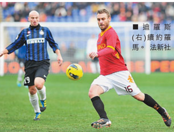
■迪羅斯(右)續約羅馬。