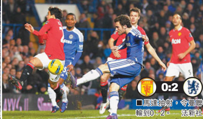
■馬達抽射，令曼聯輸到0:2。