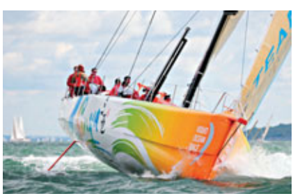
夕陽下的三亞帆船。

香港文匯報訊（記者 何政、安莉 三亞報導）沃爾沃環球帆船賽（VOLVO OCEAN RACE）賽事歷史上第一艘中國船「三亞號」於5日晚9時抵達自己的母港——三亞半島帆船港，儘管比先前抵達的5艘船晚到了一天多，港口上仍然聚集着上千名歡迎的人群，海南省副省長、三亞市委書記姜斯憲親自向邁克·桑德森船長獻上了蘭花，歡迎「三亞號」及水手們「回家」。