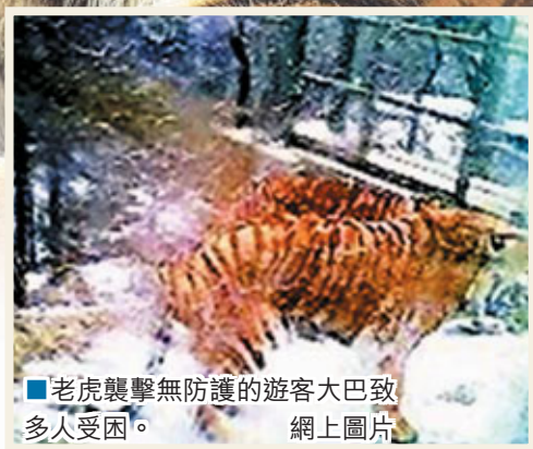
老虎襲擊無防護的遊客大巴致多人受困。

4日中午，濟南跑馬嶺野生動物世界猛獸區內，27名遊客遭到老虎群圍攻，遊覽車擋風玻璃破碎，遊客險些喪身虎口。跑馬嶺景區稱，事故原因是「老虎、遊客都太興奮」。然而這一表態卻遭到遊客一致抵制。同樣一樁遭遇，事件雙方提供了截然不同的兩種說法。 ■ 華新網