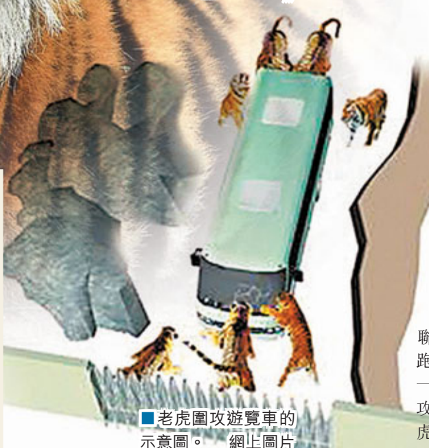
老虎圍攻遊覽車的示意圖。

「如果再拖延5分鐘，我們全車老小就全完了！」4日12:40，110熱線接到市民來電，跑馬嶺野生動物世界出事了！多名遊客遭到老虎攻擊，遊覽車擋風玻璃破碎。脫離虎口的乘客被景區安排進一處會議室，其通訊工具為關機狀態，記者無法與之取得聯繫。