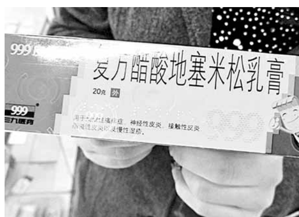
這款藥品的包裝盒上印有盲文標識。

節，我們很感動。如果說明書也能印上盲文就更好了，包括適用症、用量用法等，我們就不用麻煩別人了。」