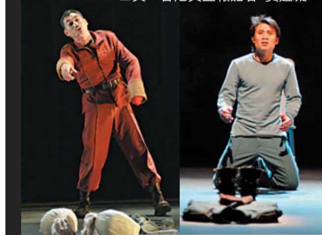
■泰特斯在兒子昆塔斯及馬歇斯的頭顱前立誓報仇。 ■昆塔斯聽見父親泰特斯支持薩特尼登上羅馬皇位時的驚愕。