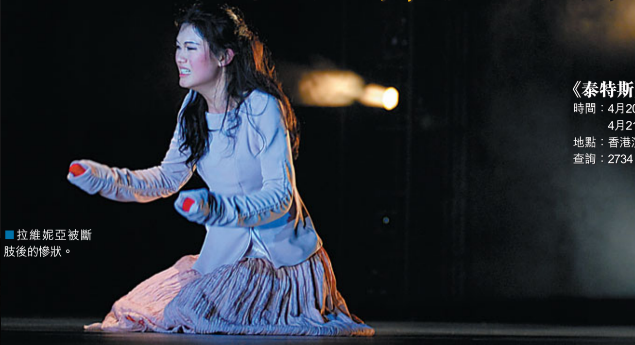
■拉維妮亞被斷肢後的慘狀。