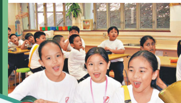
南亞裔學童可分為很多類別，擬訂題目宜先深入了解主題背景。