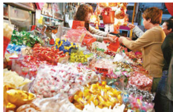
如同學家中經營辦館，有利於擬訂與辦館相關的焦點問題。

在學期初或中後，通識科教師便要求同學擬訂IES的題目，大部分同學都只會交出幾個字或者一句的題目，例如「本校學生的補習風氣」。嚴格來說，這只是主題，並非題目。這樣的「題目」無助指導教師了解同學的探究方向，當然就遑論給予具建設性的意見。之所以有這樣的結果，在於同學只集中以興趣思考探究方向，卻並沒有整體的考慮，包括主題背景、焦點問題、探究方法及報告形式等。換言之，當我們交出題目時，應該是一份計劃書的大綱，而絕對不是一兩句文字的主題，當中應包括題目、焦點問題、釐清關鍵概念、研究方法及報告形式。若指導教師同意這個大綱，則稍加擴充便可以成為一份計劃書。